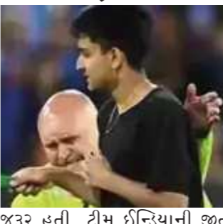
જરૂર હતી. ટીમ ઈન્ડિયાની જીત નિશ્ચિત હતી. હાર્દિક પંડ્યા ૧૭મી ઓવરનો પમો બોલ નાખવા માટે તૈયાર હતો. ત્યારે જ આ ભારતીય ફેન મેદાનમાં ઘૂસી ગયો, જેના કારણે થોડો સમય મેચ રોકી દેવામાં આવી હતી.

એરિલેડ રવિવારે મેલબોર્ન ક્રિકેટ ગ્રાઉન્ડ ખાતે ભારત અને ઝિમ્બાબ્વે વચ્ચે રમાયેલી ૨૦ વર્લ્ડ કપનીની છેલ્લી સુપર-૧૨ લીગ મેચ દરમિયાન એક ફેન તિરંગો લઈને મેદાનમાં ઘૂસી ગયો હતો. સિક્યોરિટીને હાથતાળી આપીને તે ભારતીય કેપ્ટન રોહિત શર્માની નજીક પહોંચી ગયો હતો અને તેની સાથે વાત કરતાં તે રડવા લાગ્યો હતો. સુરક્ષાકર્મીઓએ તેને પકડીને મેદાન પરથી બહાર કર્યો હતો. આ ફેન પર ૬.૫૦ લાખ રૂપિયાનો દંડ પણ ફટકારવામાં આવ્યો છે. ભારતે આ મેચ ૭૧ રને જીતી લીધી હતી. આ જીત સાથે ટીમ ઈન્ડિયાએ સેમીફાઈનલમાં પ્રવેશ કરી લીધો છે. ટીમ ઈન્ડિયાના ૧૮૭ રનના ટાર્ગેટનો પીછો કરતાં ૧૬.૪ ઓવર સુધી ઝિમ્બાબ્વેની ટીમે ૯ વિકેટના નુકસાને ૧૧૧ રન બનાવ્યા હતા. ભારતને જીતવા માટે ૧ વિકેટની