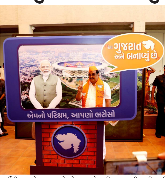
એમનો પરિશ્રમ, આપણો ભરોસો