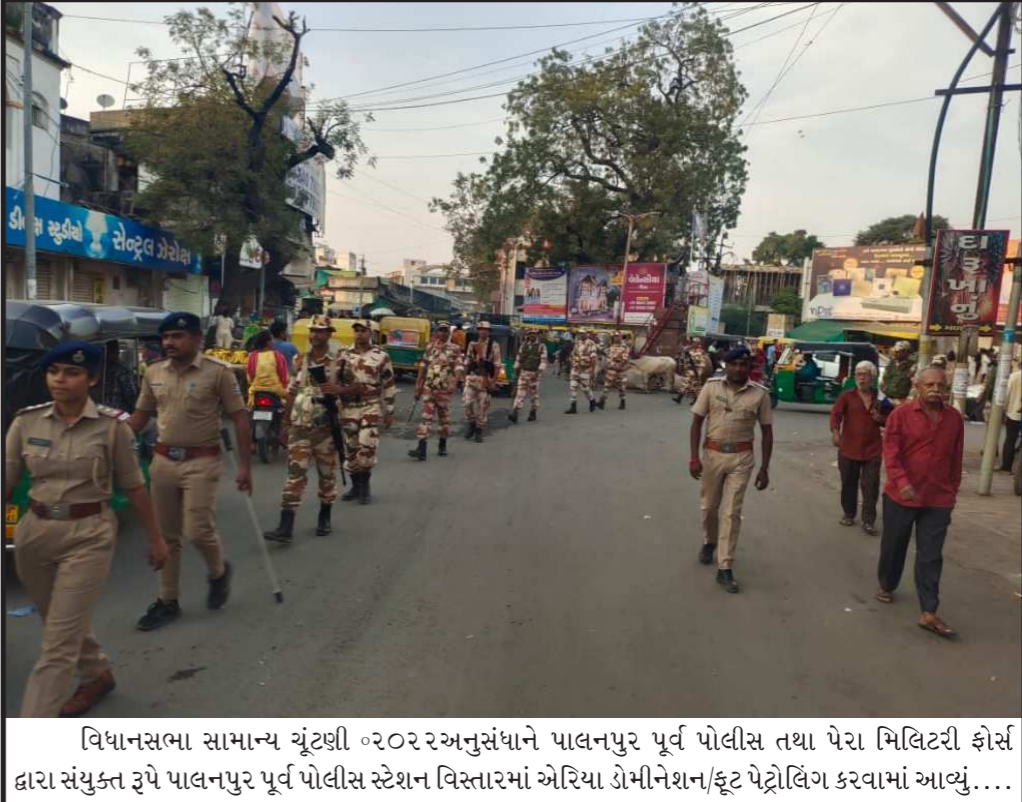
વિધાનસભા સામાન્ય ચૂંટણી ૨૦૨૨ અનુસંધાને પાલનપુર પૂર્વ પોલીસ તથા પેરા મિલિટરી ફોર્સ દ્વારા સંયુક્ત રૂપે પાલનપુર પૂર્વ પોલીસ સ્ટેશન વિસ્તારમાં એરિયા ડોમીનેશન/ફૂટ પેટ્રોલિંગ કરવામાં આવ્યું....

છોડી ઘો આ બધું ટેન્શન. ખાઓ પીઓ જલસા કરો, મોજથી ઉડાઓ પેન્શન. હુકમ ચાલે છે ત્યાં સુધી કરી લ્યો હકુમત, ભાઈ !! પછી, બૈરા છોડકરાઓ પણ નહિ માને કોઈ સજેશન!! ગુસ્સે થવાની, ગુસ્સો કરવાની ઉમર તો ગઈ હવે... કોઈ સોરી કહે તો પણ, શાંતિથી કહેજો નો મેન્શન.....!!! હાથમાં છે વહેવાર ત્યાં સુધી રાખો બધુય હસ્તગત, પછી પાણી માટેય પુછવું પડશે, એવી થશે પોજીશન...!!! શરતોમાં જીવ્યો છું ને, શરતોમાં ઘણું હાર્યો છું... હવે કહો જિંદગી ને, ડોન્ટ એપવાય એની કંડીશન.....!!! ગુમાવ્યું એનો ગમ ના કરો, મળ્યું છે એમાં મોજ કરો, કેમ કે, ક્યારે હાટે બેસી જશે, વિધાઉટ એની ઈન્ફોર્મેશન...!! ક્યારેક પાપ કર્યા હોય તો એનું કરી લેજો પ્રાયશ્ચિત...!!! ઈશ્વર ગુન્ધા માફ કરી દેશે, વિધાઉટ એની ઓબજેક્શન...!!! દોડ ધામ ચિંતા ઉતાવળ, મેલો અભરાઈ એ આ ભૂતાવળ, બીપી, સુગર ને કહો રુક જાઓ, આગળ નથી કોઈ પરમિશન...!!! મૃત્યુ આવે તો મરવાનું મજાથી, ડરવાનું નહિ પુદા/ભગવાન ની સજાથી, અને હસ્તે મોઢે હાલતા થવાનું, આપ્યા વગર કોઈ ઓપ્શન....!!!! આભાર સહ મનોજકુમાર આર.સરૈયા ના જય શ્રી કૃષ્ણ: