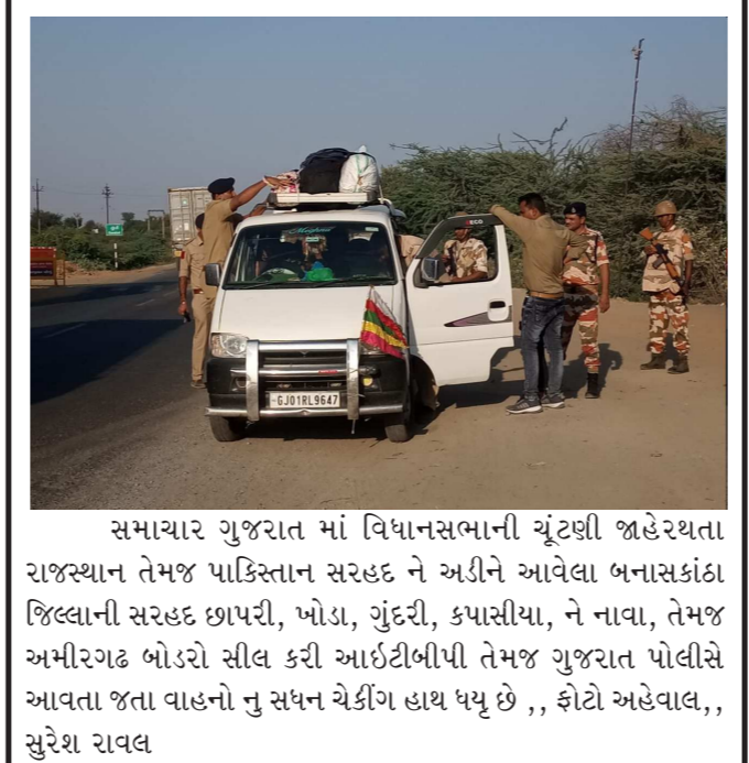
સમાચાર ગુજરાત માં વિધાનસભાની ચૂંટણી જાહેરથતા રાજસ્થાન તેમજ પાકિસ્તાન સરહદ ને અડીને આવેલા બનાસકાંઠા જિલ્લાની સરહદ છાપરી, ખોડા, ગુંદરી, કપાસીયા, ને નાવા, તેમજ અમીરગઢ બોડરો સીલ કરી આઈટીબીપી તેમજ ગુજરાત પોલીસે આવતા જતા વાહનો નુ સઘન ચેકિંગ હાથ ધર્યું છે , , કોટો અહેવાલ, , સુરેશ રાવલ