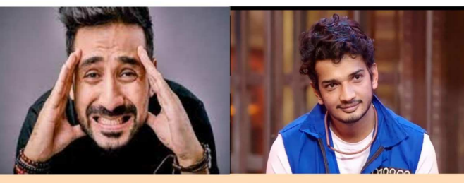
Vir Das and Munna Farukhi's Shows Cancelled