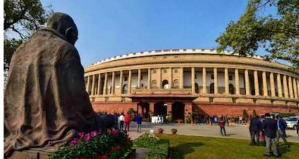
નવીદિલ્હી, તા. ૧૯ ડિસેમ્બર સુધી ચાલશે. તેમણે ટ્રિવિટ કરીને કહ્યું કે, 'સંસદનું શિયાળુ સત્ર ૭ ડિસેમ્બર ૨૦૨૨ થી શરૂ થશે અને ૨૮ ડિસેમ્બર સુધી ચાલશે. જેમાં ૨૩ દિવસમાં ૧૭ બેઠકો થશે. અમૃતકાળ વચ્ચે સત્ર દરમિયાન કાયદાકીય કામકાજ અને અન્ય મતો પર ચર્ચા થવાની અપેક્ષા છે. અમે

વર્તમાન સાંસદોના નિધનને ધ્યાનમાં રાખીને આગામી સત્રના પ્રથમ દિવસ સ્થગિત થવાની શક્યતા