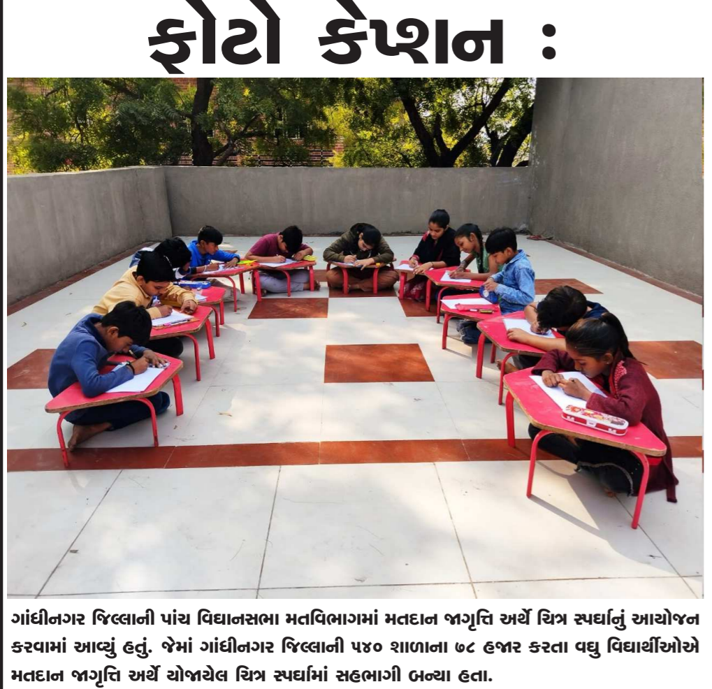
ગાંધીનગર જિલ્લાની પાંચ વિધાનસભા મતવિભાગમાં મતદાન જાગૃતિ અર્થે ચિત્ર સ્પર્ધાનું આયોજન કરવામાં આવ્યું હતું. જેમાં ગાંધીનગર જિલ્લાની ૫૪૦ શાળાના ૭૮ હજાર કરતા વધુ વિદ્યાર્થીઓએ મતદાન જાગૃતિ અર્થે યોજાયેલ ચિત્ર સ્પર્ધામાં સહભાગી બન્યા હતા.

આહવા: તા: ૧૫: ૧૭૩-ગંગ વિધાનસભા મત વિસ્તારમાં કાર્યરત MCMC તથા મીડિયા સેન્ટરની મુલાકાત લઈ, જિલ્લા ચૂંટણી અધિકારી શ્રી ધર્મેશ્વરજી જાડેજાએ ફરજ નિયુક્ત કર્મચારી/અધિકારીઓને ખુબ જ ચોકસાઈ સાથે મીડિયા મોનિટરીંગની કામગીરી કરવા બાબતે માર્ગદર્શન આપ્યું હતું. ગંગ જિલ્લા માહિતી કચેરી આહવા ખાતે કાર્યરત MCMC સેન્ટરના માધ્યમથી ‘મીડિયા સર્ટિફિકેશન અને મોનિટરીંગ’ની કામગીરી કરવા સાથે, મીડિયા સેન્ટરના માધ્યમથી જિલ્લાની ચૂંટણીલક્ષી વિગતો ડિસ્ક્રે કરી, લોકશાહીના અવસરમાં પ્રજાજનોની ભાગીદારી સુનિશ્ચિત કરવાનો પ્રયાસ હાથ ધરવામા આવ્યો છે, તેમ જણાવી જિલ્લા ચૂંટણી અધિકારીશ્રીએ, ચૂંટણી પ્રક્રિયા સંલગ્ન સૂક્ષ્મ માહિતી મેળવવા વધુમા વધુ લોકોને મીડિયા સેન્ટરની મુલાકાત લેવાની અપીલ કરી હતી. કલેક્ટરશ્રીની આ