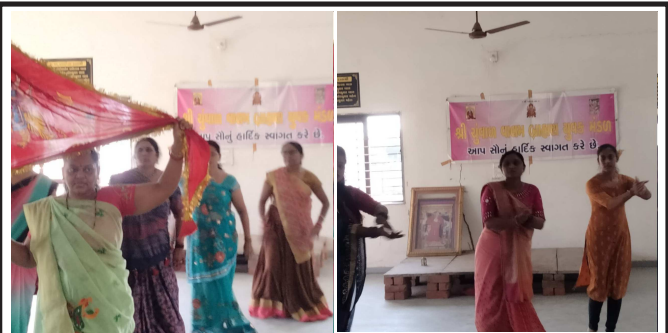
ચુંવાળ વાલમ બ્રાહમણ યુવક મંડળ દ્વારા વાલમ બ્રાહમણ ની કુળદેવી વાધેશ્વરી નાં માદિર ઓગણજ ખાતે શાંતિજનોએ સાતમા નોરતા એ ગરબા ગાઈ માં વાધેશ્વરી ની પૂજા અર્ચના કરી હતી

નવરાત્રિની સાથે જ હિંદુ તહેવારોનો દોર શરૂ થઈ ચૂક્યો છે. લેસ્ટરમાં પોલીસની હાજરી વધારી દેવામાં આવી છે, પરંતુ માહોલમાં દહેશત છે. સવાલ ઊઠે છે કે રમતને લઈને થનારી તકરારે અચાનક આટલું ગંભીર રૂપ કેવી રીતે ધારણ કરી લીધું? મુસ્લિમ પક્ષનું અને ઘટનાઓને ફક્ત મોટી વિરોધી દષ્ટિકોણથી જોનારાઓનું માનવું છે કે આ ભારતમાં ફેલાઈ રહેલા કથિત ઉગ્ર હિંદુવાદનું પરિણામ છે, પરંતુ ત્યાં રહેનારા જણાવે છે કે લેસ્ટર ભારતમાં થનારી રાજકીય ઘટનાઓની અસરથી વણરમ્યરૂપે ક્યારેય નથી રહ્યું. પાલિસ્તાની આંદોલનના દિવસોમાં પણ લેસ્ટરમાં છૂટક આંતરકી ઘટનાઓ થતી રહી છે. એ જ રીતે બાબરી ઢાંચાના વિધ્વસન અને ગુજરાત રમખાણો સમયે પણ ઘણો તણાવ રહ્યો, પરંતુ આટલો માહોલ પહેલાં ક્યારેય નથી બગડ્યો. તેનું કારણ હિંદુ ઉગ્રવાદનું લેસ્ટર અને ઈંગ્લેન્ડના બાકી શહેરોમાં આવવું નથી, કારણ કે પોલીસ અને ગુમચર એજન્સીઓ વારંવાર કહી ચૂકી છે કે આ વાતના કોઈ પુરાવા નથી. અસલ કારણ ભારતથી આવીને વસેલા અને બાકી દેશોના મુસલમાનોના એક વર્ગનું ભારતમાં ચાલી રહેલા ઘટનાક્રમના રિપોર્ટ વાંચીને ઉગ્ર થઈ જવાનું છે.