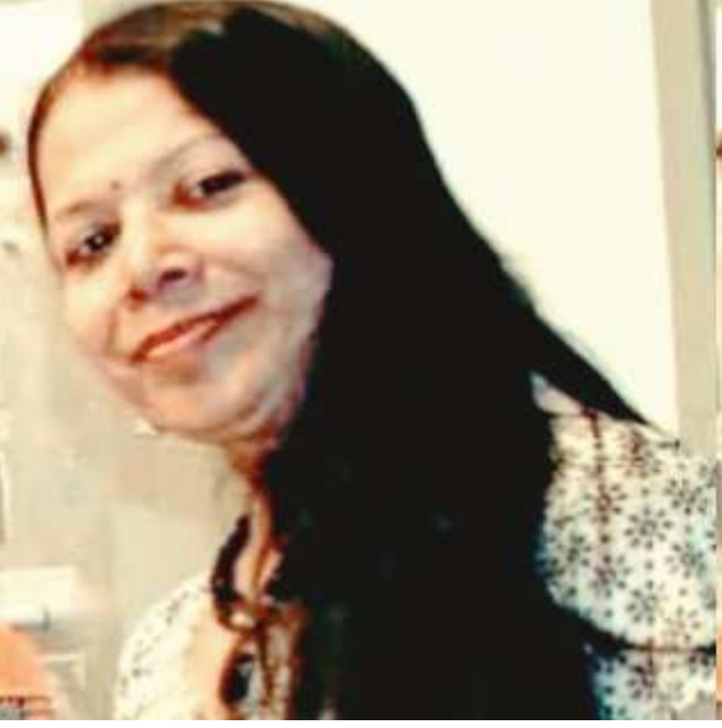
NOG SS No : 0092 પ્રકાર:- વધ

વિષય :- દિવા સ્વપ્નો શિર્ષક :- કલ્પનાશીલતાનું ફરજદ દિવા સ્વપ્નો સ્વપ્નો, દિવા સ્વપ્નોની વચ્ચે, અથડાતી, કુટાતી ને ઘડાતી જિંદગી. ક્યારેક લાગે વ્યર્થ ને નકામી તો, ક્યારેક લાગે જાણે પુદાની બંદગી. હતું એક પહેલું દિવા સ્વપ્ન કે, પ્રેમ અઢળક પામું સહુનો. આપવામાંય ના ઉછી ઉતરું ને, પામું પારાવાર પ્રેમ સહુનો. આપી- આપીને હૃદય ખાલી કર્યું, પામી ના પ્રેમ તલભાર કોઈનો. ઉણપ આ જીવનની હવે જીવ બની, આપું છું પુદને જ હવે હું પ્રેમ સહુનો. બીજું દિવા સ્વપ્ન હતું કે જેવી હું છું તેવી જ આ દુનિયા, સરળ અને નિખાલસ છે. મને મળતા બધા જ ચહેરા, અહીં નિષ્કપટ ને સાલસ છે. અનુભવોના એરણ પર એય તૂટતું રહ્યું,