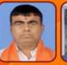
જીજ્ઞેશ ઢકકર મંત્રી