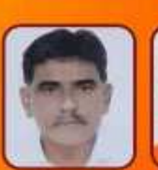
અવોકજી ઢાઢોર ઉપમુખ