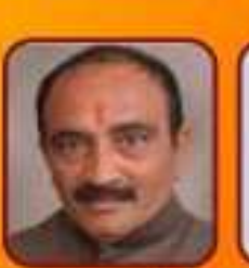
છનન્યામભાઈ પટેલ ઉપમુખ