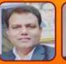
ડૉ. નીતિન ઇંજન મંત્રી