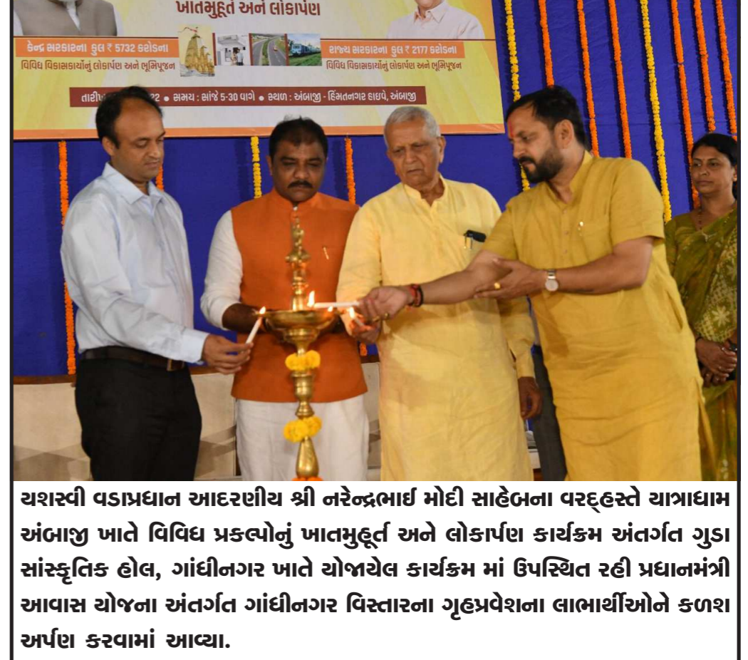
યશસ્વી વડાપ્રધાન આદરણીય શ્રી નરેન્દ્રભાઈ મોદી સાહેબના વરદ્હસ્તે યાગ્રાધામ અંબાજી ખાતે વિવિધ પ્રકલ્પોનું ખાતમુહૂર્ત અને લોકાર્પણ કાર્યક્રમ અંતર્ગત ગુડા સાંસ્કૃતિક હોલ, ગાંધીનગર ખાતે યોજાયેલ કાર્યક્રમ માં ઉપસ્થિત રહી પ્રધાનમંત્રી આવાસ યોજના અંતર્ગત ગાંધીનગર વિસ્તારના ગૃહપ્રવેશના લાભાર્થીઓને કળાશ અર્પણ કરવામાં આવ્યા.

જુનાગઢ,તા.૧ જુનાગઢને પ્રવાસન ક્ષેત્રે વેગ મળે તે માટે મનપા સ્થાઈ સમિતિ દ્વારા ગઈકાલે મળેલી બેઠકમાં આ.ર.૭૨ કરોડના વિકાસ કામોને મંજૂરી અપાઈ છે. જેમાં મારુ જુનાગઢ આર્કકર્ષ જુનાગઢના સુત્રને સાર્થક કરવા માટે મનપા દ્વારા વિવિધ કામોના આયોજનો કર્યા છે. જેમાં ગિરનાર દરવાજા વિસ્તારમાં હેયાત આઘ કવિ નરસિંહ મહેતાની ૧૦ ફૂટની કરતાલ સાથેની નવી પ્રતિમા તથા સર્કલ ડેવલોપ કરવામાં આવશે તેમજ ભવનાથ જિલ્લા પંચાયત ગ્રાઉન્ડ વિસ્તાર કે સમો આ વિસ્તાર હોય અહીં પ્રભુની ઓળખ સમો વિસ્તાર હોય અહીં પ્લે ગ્રાઉન્ડ અને ફોરેસ્ટ ક્વાર્ટર્સ વચ્ચેની જગ્યામાં સર્કલ ડેવલપ કરીને ભોળાનાથની ૨૫ ફૂટની પ્રતિમા મુકી લોકઆકર્ષણ સ્થળ તૈયાર કરવામાં આવશે. પામદ્રોળ રોડ પર સર્કલ તૈયાર થશે, અશોક શીલાલેખની સામેના ભાગે પીપીપી મોડેલથી બે સેલ્ફી પોઈન્ટ તૈયાર કરવામાં આવશે જેમાં શહેરની એન્ટ્રી તથા પ્રવાસીઓને આકર્ષણ જમાવવા આઈ લવ યુ જુનાગઢ, વી લવ યુ જુનાગઢ શિર્ષક હેલ્ગ સેલ્ફી પોઈન્ટ બનશે. ૧ નવેમ્બરના જુનાગઢ આઝાદી દીનને ઉજવવા તા. ૧ થી ૧૩ નવેમ્બર સુધી સંગીત કલાકારો, નૃત્યકારો સાથે ઉજવણી કરાશે.