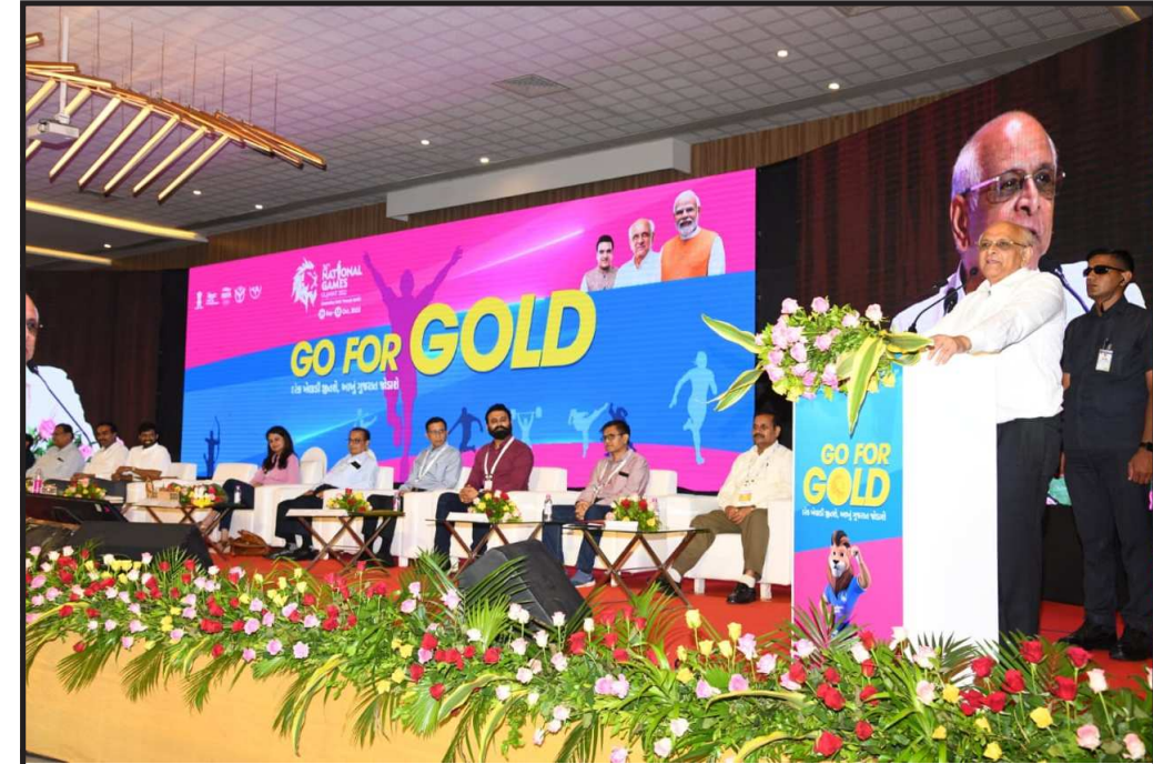
૨૦૨૨ અંતર્ગત મુખ્યમંત્રી શ્રી ભૂપેન્દ્રપટેલની અધ્યક્ષતામાં અમદાવાદ ખાતે "Go For Gold" કાર્યક્રમ યોજાયો