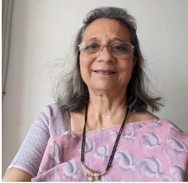
N.O.G. SS. NO. 0026. વિષય - તર્પણ.