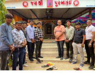
ફરીને માતાજીના નીજ મંદિરે શોભાયાત્રા પૂર્ણ કરવામાં આવી હતી આ શોભાયાત્રા દરમિયાન મોટી સંખ્યામાં ગામ લોકો તેમજ આજુબાજુના ગામના ભગતો અને લોકો મોટી સંખ્યામાં જોડાયા હતા ગામના ગોદરાથી ગામ ની ફરતે

રિપોર્ટ નિખિલ જોશી પાટણ બ્યુરો વામૈયા પાટણ જિલ્લાના સરસ્વતી તાલુકામાં આવેલા વામૈયા ખાતે જયશ્રી પુરબાફઈ માતાજીનો બીજો પાટોત્સવ યોજવામાં આવ્યો હતો સરસ્વતીના વામૈયા ખાતે આવેલા પુરબાફઈ માતાજી ના મંદિર નો બીજો પાટોત્સવ યોજાયો હતો જેમાં હવન યજ્ઞ કરવામાં આવ્યો હતો અને સવારે ડીજેના તાલે ભવ્ય શોભાયાત્રા નિકળી હતી જેમાં ગામના ગોદરાથી ગામ ની ફરતે