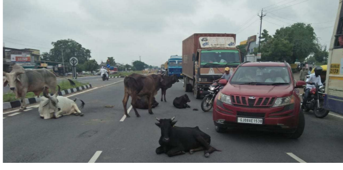
(બનાસકાંઠા સમાચાર) ગામના જાહેર માર્ગ ઉપર અવાર પાલનપુરના કાણોદર નવાર અકસ્માત સર્જાય છે. જેમાં

અનેક લોકો મોત ને ભેટયા છે. ત્યારે છેલ્લા કેટલાય સમયથી જાહેર માર્ગ ઉપર રખડતા ઢોરોનો ખડકલો હોવાથી જાહેર માર્ગ ઉપર અકસ્માત થાય છે અને અકસ્માતના પગલે નિર્દોષ લોકોના મોત થાય છે ત્યારે સત્વરે બનાસકાંઠા જિલ્લા વહીવટ તંત્ર દ્વારા આ રખડતા ઢોરોને પંજારાપોળે મુકવામાં આવે અને આ અકસ્માત બંધ થાય તે માટેના યથાર્થ પ્રયત્ન કરવામાં આવે તેવી લોક માંગ ઉઠવા પામી છે.