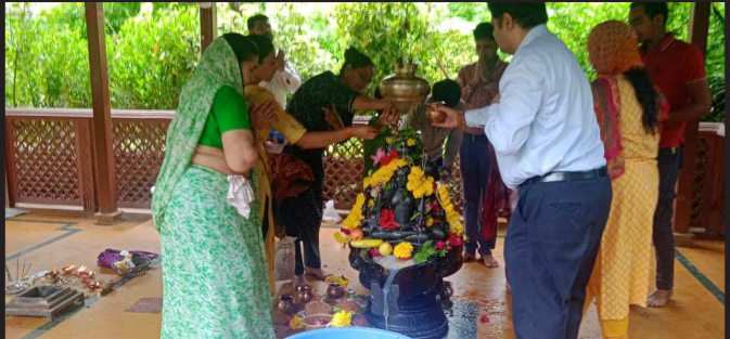
શ્રાવણ માસ ના પવિત્ર દિવસોના પહેલા સોમવારે સમુત્કસે મહાદેવ મંદિરે શિવભક્તો થી ઉભરાઈ રહ્યા છે ત્યારે વહેલી સવાર ભક્તો પુજા અર્ચના કરવા ઉભેલા હોય છે અને મંત્રોચ્ચાર સાથે ઝૂં નમઃ શિવાય બોલતા સંભળાય છે