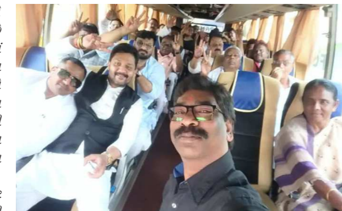
ધારાસભ્યો સાથે બસમાં હતાં અને તેઓએ ધારાસભ્યો સાથે સેલ્ફી પણ લીધી છે. ત્રણેય બસોને પોલીસ સુરક્ષાની વચ્ચે ખુંટીથી લતરાતુ ડેમ લવાઈ છે. ખુંટીના ડુમરગઢી ગેસ્ટ હાઉસમાં ખુરસીઓ અને ગાદલા મંગવાયા છે. ગેસ્ટ હાઉસ બહાર મોટી સંખ્યામાં પોલીસ ફોર્સ તહેનાત છે. ખુંટીના ડેમ અને એસપી પહોંચી ગયા છે. લતરાતુ ડેમના ગેસ્ટ

રિસોર્ટમાં રાખવામાં આવશે છત્તીસગઢમાં યુપીએની સરકાર છે આથી ધારાસભ્યોને અહીં લાવવામાં આવ્યા છે. હેમંત સોરેને પણ પોતાના ઈરાદા જાહેર કરી દીધા છે. તેમણે દ્વિવટ કરીને કહ્યું કે, આ આદિવાસીનો દીકરો છે. તેમની ચાલથી અમારો રસ્તો ના ક્યારેય અટકવો છે, ના અમે લોકો ક્યારેય આ લોકોથી ડર્યા છીએ. ઝારખંડમાં રાજકીય સંકટ વચ્ચે શનિવારે મુખ્યમંત્રી નિવારણનેથી ૩ બસમાં ધારાસભ્યોને શિકટ કરાઈ હતી બસમાં કોંગ્રેસના અને જેએમએમના ૩૬ ધારાસભ્યો સામેલ હતાં મુખ્યમંત્રી હેમંત સોરેન પણ