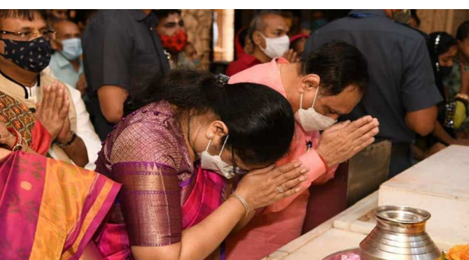
ગીરસોમનાથ, તા. ૨૭ પૂર્વ મુખ્યમંત્રી રૂપાણીએ શ્રાવણ મહિનાના અંતિમ દિવસે સોમનાથના દર્શન કરીને મહાદેવ સામે શીશુ ઝુકાવ્યું હતું. ગુજરાત વિધાનસભાની ચૂંટણી પૂર્વે રાજ્યના પૂર્વ મુખ્યમંત્રી વિજય રૂપાણીએ ફરી ચૂંટણી લડવા અંગે મહત્વનું નિવેદન આપીને ખગભળાટ મચાવ્યો છે. વિજય રૂપાણીએ જણાવ્યું હતું કે, પાર્ટી

ચૂંટણીલક્ષી મોટું નિવેદન આપ્યું છે. રાજકોટમાં વજુભાઈ વાળા ફરી રાજકોટમાં સક્રિય થયા છે ત્યારે પ્રવર્તમાન રાજકીય સ્થિતિમાં વિધાનસભાની ટીકીટ મુદ્દે વિજય રૂપાણીએ જણાવ્યું હતું કે, પાર્ટી લડાવશે તો લડીશું, કોઈને જીતાડવાનું કહેશે તો જીતાડીશું... ભાજપમાં પ્રદેશ કક્ષાએ કોઈ જૂથવાદ ન હોવાનું જણાવ્યું હતું. બીજા બાજુ રાજ્યના બે કેબિનેટ મંત્રીઓને કટડ સાઈટ કરી પાતા આંકડી લેવા મુદ્દે આ વ્યવસ્થાનો ભાગ હોવાનું જણાવ્યું હતું. વિજય રૂપાણીએ નિવેદન આપતા જણાવ્યું કે, 'અમે કોઈ પદ કે કોઈ ટિકિટો માટે કામ કરતા નથી. એક સ્વપ્ન છે કે ભારતમાતા શક્તિશાળી ભારતમાતા બને. પરમવૈભવના શિખર પર ભારત