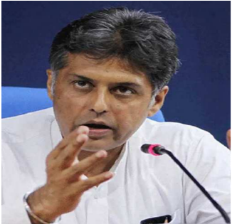
નવીદિલ્હી, તા. ૨૭

કોંગ્રેસના વરિષ્ઠ નેતા અને રાજ્યસભામાં વિપક્ષના નેતા ગુલામ નબી આઝાદે શુક્રવારે સોનિયા ગાંધીને પાંચ પાનાનો પત્ર લખીને પાર્ટીમાંથી રાજીનામું આપી દીધું છે. આ રાજકીય ઘટના બાદ રાજ્યસભા સાંસદ મનીષ તિવારીએ ફરી એકવાર પોતાની પાર્ટીને સલાહ આપી છે. તેમણે કહ્યું છે કે જો જી-૨૩એ પાર્ટીની સ્થિતિ અંગે કોંગ્રેસ સુપ્રીમોને પત્ર લખ્યો હતો, જો તેના પર ધ્યાન આપવામાં આવ્યું હોત તો આજે આવી સ્થિતિ સર્જાઈ ન હોત. સાથે જ પોતાની સ્થિતિ સ્પષ્ટ કરતાં તેમણે કહ્યું કે હું ભાડુઆત નથી, પરંતુ આ પાર્ટીનો સભ્ય છું.