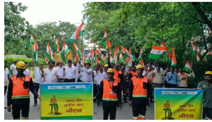
ગાંધીનગર, ૨૦ ઓગસ્ટ, ૨૦૨૨:

આઝાદીના આંદોલનમાં જ્યાં એક તરફ મહાત્મા ગાંધી અંગ્રેજો સામે અભિયાન ચલાવી રહ્યા હતા ત્યાં બીજી તરફ તેઓ સમાજમાં ફેલાયેલી કુરીતોનો સામે પણ લડી રહ્યા હતા. એ સમયમાં ગાંધીજીએ જ દૂધાદૂધ અને માથે મેકું ઉપાડવાની પ્રથા વિરુદ્ધ જાગૃતિ અભિયાન ચલાવ્યું હતું અને સ્વચ્છતા સાથે સંકળાયેલા લોકોને સન્માન અપાવવા માટે જન આંદોલન પણ કર્યું હતું. આ જન આંદોલનને નવું બળ ત્યારે મળ્યું જ્યારે વડાપ્રધાન નરેન્દ્ર મોદીએ ઝડપ લગાવીને સ્વચ્છતા અભિયાન અને સ્વચ્છતા સાથે સંકળાયેલા લોકોને મજબૂતી પ્રદાન કરી. ૭૫ વર્ષના ઇતિહાસમાં પ્રથમ વખત આ રાષ્ટ્ર એક વડાપ્રધાનને સફાઈકર્મીઓના પગ ધોઈને તેમનું માન સન્માન અને સ્વીકાર્યતા સ્થાપિત કરતા જોયા હતા. વડાપ્રધાન નરેન્દ્ર મોદીએ સફાઈ મિત્રોની પ્રશંસા કરતા કહ્યું હતું. - 'આપણા સફાઈ કર્મચારી, આપણા ભાઈ-બહેન, સાચા અર્થમાં આ અભિયાનના નાયક છે'. સીવરમાં ઉતરીને સફાઈ કરવી અને દુર્ઘટના થવા પર જીવ ગુમાવવો એ આજના પ્રગતિશીલ મંત્રાલય તરફથી સફાઈમિત્રોને યુગમાં કોઈ પણ સ્તરે ન્યાયપૂર્ણ નથી. તેને દૂર કરવા માટે કેન્દ્રની મોદી સરકારે ૨૦૨૪ સુધી દેશના ૫૦૦ શહેરોને મશીન આધારિત સફાઈમિત્ર સાથે જોડવાનું