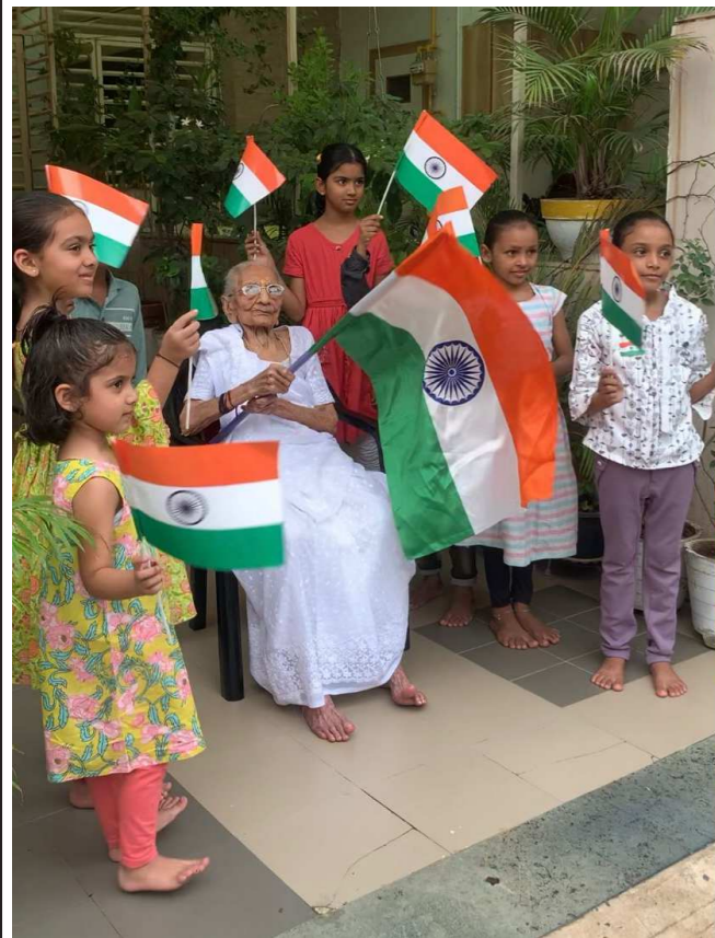
વડાપ્રધાનશ્રી નરેન્દ્રમોદીનાં માતૃશ્રી હીરાબા એસામાવ્ય પરિવારનાં બાળકોને રાષ્ટ્રધ્વજ વિતરણકરી બાળકો સાથે તિરંગો લહેરાવ્યો