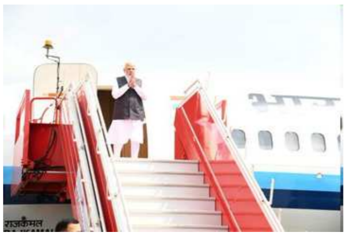
અનુસાર વડાપ્રધાન નરેન્દ્ર મોદીએ મેટ્રો પ્રોજેક્ટની કામગીરીને લઈને અધિકારીઓનો ઉદ્ઘોષ લીધો હતો. વિમાની મથકેથી પાંચ વાગ્યા બાદ વડાપ્રધાન નરેન્દ્ર મોદી સીધા

અમદાવાદ, તા. ૨૭ વડાપ્રધાન નરેન્દ્ર મોદી આજથી બે દિવસની ગુજરાતની મુલાકાતે આવી પહોંચ્યા છે. વડાપ્રધાન નરેન્દ્ર મોદીએ તેમની ગુજરાત મુલાકાતના પ્રથમ દિવસે અમદાવાદમાં અટલ ફૂટ-ઓવર બિજનું ઉદ્ઘાટન કર્યું હતું. ભૂતપૂર્વ વડા પ્રધાન અટલ બિહારી વાજપેયીના નામ પરથી આ ફૂટબિજ સાબરમતી રિવરફ્રન્ટ પર એલિસ બ્રિજ અને સરદાર બ્રિજ વચ્ચે બાંધવામાં આવ્યો છે. પદયાત્રીઓ માટે બનાવવામાં આવેલો અટલ પુલ ખૂબ જ સુંદર છે. તેની સજાવટ પણ અદ્ભુત રીતે કરવામાં આવી છે. આ પહેલા વડાપ્રધાન નરેન્દ્ર મોદી અમદાવાદના વિમાની મથકે આવી