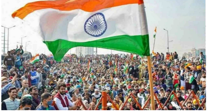
આગેવાનો અને મુખ્યમંત્રી ભગવંતમાન વચ્ચે ૪ કલાક ચાલેલી બેઠક બાદ ખેડૂતોએ તેમનું આંદોલન સ્થગિત કરી દીધું હતું. વાસ્તવમાં, બેઠકમાં મુખ્ય પ્રધાન ભગવંતમાને શેરડીના બાકી ચૂકવણી સહિત ખેડૂત સંગઠનોની મોટાભાગની માગણીઓ સ્વીકારી હતી. જે બાદ ખેડૂત નેતાઓ ૩ ઓગસ્ટે તેમના પ્રસ્તાવિત

ખેડૂતોએ ૨૪ કરોડ રૂપિયાની શેરડીની બાકી ચૂકવણી કરવાની છે. જેના માટે ખેડૂતો આ દિવસોમાં જલંધર-ફગવાડા હાઈવે પર ધરણા કરી રહ્યા છે. આ ક્રમમાં ભાવિ રણનીતિ નક્કી કરવા માટે બેઠક યોજાઈ હતી. જેમાં માગણીઓ નહીં સંતોષાય ત્યાં સુધી તેમજ ૩૦મી ઓગસ્ટ સુધી હડતાળ ચાલુ રહેશે અને ત્યારબાદ ૫ સપ્ટેમ્બરથી આંદોલન શરૂ કરવામાં આવશે. શેરડીની બાકી ચૂકવણી માટે આંદોલનની ચેતવણી આપતા ખેડૂતોએ અગાઉ ૩ ઓગસ્ટથી આંદોલનની તૈયારીઓ કરી લીધી હતી. પરંતુ, આ પહેલા ખેડૂત