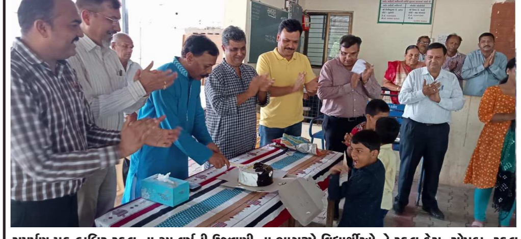
સમર્પણ મુક બંધિર સ્કુલ ના ૩૫ વર્ષની ઉજવણી ના ભાગરૂપે વિદ્યાર્થીઓ ને સ્કુલ ટ્રેસ, ચોપડા, સ્કુલ યુનિફોર્મ નું વિતરણ તેમજ વૃક્ષારોપણ કરવામાં આવ્યું. સમર્પણ સ્કુલનો પાચો નાખવા માં સ્વ. શ્રી કલમશેશભાઈ જાની નો ફાળો મુખ્યત્વે હતો. તેમના નેતૃત્વ તેમજ દૂરદ્રષ્ટિ ના કારણે આજે આ સંસ્થા નું નિર્માણ થઈ શક્યું છે.

આ રજૂઆતો અને અરજીઓના નિકાલની કામગીરી સાંજે ૫ વાગ્યા સુધી કરવામાં આવશે. જે દરમિયાન અરજદારોને તેમણે કરેલ રજૂઆતોના આખરી નિકાલની જાણ કરવામાં આવશે. આ કાર્યક્રમ દરમિયાન મતદાર યાદી સુધારણા કેમ્પ રાખવામાં આવેલ છે. જેમાં ગાંધીનગરના નાગરિકો મતદાર યાદીમાં નામ ઉમેરવા, નામ કમી કરવા, ચૂંટણી કાર્ડમાં સુધારો કરવા માંગતા હોય તો સુધારો કરાવી શકશે. ખાસ કરીને નવીન મતદારો તેમનું નામ મતદાર યાદીમાં ઉમેરાવી શકશે. સેવાસેતુ કાર્યક્રમ દરમિયાન ઈ-શ્રમ કાર્ડ નોંધણી કેમ્પનું પણ આયોજન કરેલ છે. અસંગઠિત ક્ષેત્રે કામ કરતા કામદારો ને ઈ-શ્રમ કાર્ડની નોંધણી બાદ સરકારની વિવિધ યોજનાઓનો લાભ મળી શકે તે હેતુથી આ કેમ્પનું આયોજન કરવામાં આવ્યું છે. જે શ્રમિકોની ઉંમર ૧૬ થી ૬૦ વર્ષની છે, તેઓ આ કેમ્પનો લાભ લઈ શકશે. આ કેમ્પ દ્વારા લાભાર્થી આધાર કાર્ડ, મોબાઈલ નંબર અને બેંક પાસબુકની નકલ સાથે રાખીને ઈ-શ્રમ કાર્ડ માટે નોંધણી કરાવી શકશે અને સરકારની આ યોજનાનો લાભ મેળવી શકશે. આ સાથે પર્યાવરણની સુરક્ષાના સંદેશાને પ્રસારવા માટે વૃક્ષારોપણ કાર્યક્રમનું પણ આયોજન કરવામાં આવશે. જેમાં ગાંધીનગર મહાનગરપાલિકા તથા ઉચ્ચ અધિકારીશ્રીઓ દ્વારા વૃક્ષારોપણ કરવામાં આવશે.