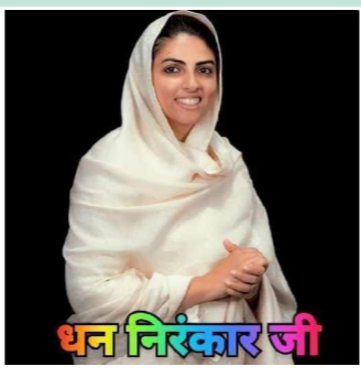
પન નિરંકાર જી

હું માનવી માનવ થાઉં તો ઘણું” જાણીતા લેખક/કવિની આ પંક્તિ સાચી છે કે નહિ? ‘મનુર્ભવ’ પણ માનવીને જ કહેવું પડ્યું છે ને? અર્થાત, માનવી તું માનવ બન. ક્યારેય કોઈ પશુ-પક્ષી માટે કોઈને કહેતાં સાંભળ્યા છે? કે કૂતરા તું કૂતરો બન, ગીધ તું ગીધ બન કે ગધેડા, ગધેડો બન, ઉલટાની હમેશા માનવીની તુલના જ પશુ પક્ષીઓ સાથે થઈ છે તે પછી