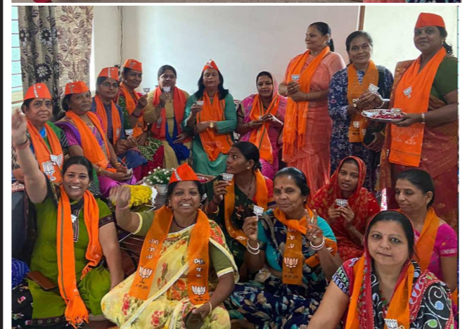
શહેર ભાજપ મહિલા મોરચા દ્વારા પાલજ, ખોરજ, પોર, સે.૧૩ ખાતે સદસ્યતા મુંબેશ