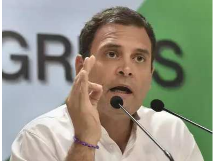
ઉદયપુર, તા. ૨૯ ઉદયપુર હત્યાકાંડ પર કોંગ્રેસ નેતા રાહુલ ગાંધીની પ્રતિક્રિયાથી ભારતીય જનતા પાર્ટીના નેતાઓ સંતુષ્ટ નથી. કેબિનેટ મંત્રી ગિરિરાજ સિંહે ટ્વીટ દ્વારા રાહુલને

સલાહ આપી છે. મંગળવારે બે હુમલાખોરોએ ઉદયપુરમાં દરજીની દુકાનમાં ઘાતકી હત્યા કરી હતી. તેણે આ ઘટનાનો વીડિયો પણ રેકોર્ડ કર્યો હતો. ભારતીય જનતા પાર્ટીના પૂર્વ પ્રવક્તા નુપુર શર્માના સમર્થનમાં પોસ્ટને કારણે આ હત્યા કરવામાં આવી હોવાના અહેવાલ છે. બિહારના બેગુસરાયના સંસદ અને ભારતીય જનતા પાર્ટીના નેતા ગિરિરાજ સિંહે રાહુલ ગાંધીને ‘ધર્મ’ને બદલે ‘ધર્મ’ કહેવાની સલાહ આપી છે. વાસ્તવમાં, પૂર્વ કોંગ્રેસ અધ્યક્ષે ટ્વિટ કર્યું હતું કે, ‘ઉદયપુરમાં જન્મ્ય હત્યાથી હું ખૂબ જ આઘાતમાં છું. ધર્મના નામે ફૂરતા સહન કરી શકાય નહીં. આ