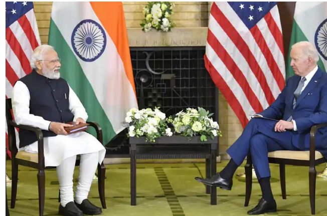
આમંત્રિત કર્યા. મોદી ટોક્યોમાં પોતાના પહેલા દિવસે ઈન્ડો-પેસેફિક ઈકોનોમિક ફેમવર્ક ઈવેન્ટમાં પણ સામેલ થયા હતા. મોદીએ જાપાનની મુલાકાત દરમિયાન ઓટોમાબાઈલની જાણીતી સુઝુકી કોર્પોરેશનના ઓડવાઈઝર ઓસામુ સુઝુકી સાથે મુલાકાત કરી. એ પછી સોફ્ટબેંક ગ્રુપ કોર્પોરેશનના બોર્ડ ડાયરેક્ટર મુલાકાત દરમિયાન ઓટોમાબાઈલની જાણીતી સુઝુકી કોર્પોરેશનના ઓડવાઈઝર ઓસામુ સુઝુકી સાથે મુલાકાત કરી. એ પછી સોફ્ટબેંક ગ્રુપ કોર્પોરેશનના બોર્ડ ડાયરેક્ટર મુલાકાત દરમિયાન ઓટોમાબાઈલની

જવાબદાર ઠેરવ્યું છે. તેમણે આગળ કહ્યું હતું કે રશિયા જંગ સમાપ્ત કરવાના મૂડમાં નથી. બીજી બાજુ અમેરિકા રાષ્ટ્રપતિ જો બાઈડેને કહ્યું કે પીએમ મોદી, આપણા દેશ ભેગા મળીને ઘણું બધું કરી શકે છે અને કરશે પણ ખરા. હું પૃથ્વી પર અમારા સૌથી નજીકના વચ્ચે અમેરિકા-ભારત ભાગીદારી બનાવવા માટે પ્રતિબદ્ધ છું. અહીં પણ તેમણે રશિયા-યુકેન યુદ્ધનો ઉલ્લેખ કરતા કહ્યું કે અમે યુકેન પર રશિયાના કુદર અને બિનન્યાયસંગત આક્રમણના પ્રભાવો અને સમગ્ર વિશ્વ વ્યવસ્થા પર તેની અસર વિશે પણ ચર્ચા કરી. અમેરિકા અને ભારત આ નકારાત્મક અસરોને કેવી રીતે ઓછી કરી શકાય