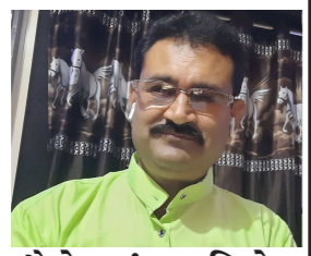
શૈલેષ પંચા નિશિષ (જામનગર)

મા જ્યારે પણ શિશુને વહાલ કરે ઈશ્વર મુદ ત્યાં આવીને ગાલ ધરે. થાકી એ દશ્યો જોઈ આંખ હવે, કોઈ આવી તિરંગો લાલ ધરે. અશ્રુની પીઠે ખંજર ખોસીને એ પાછા આંખોને રૂમાલ ધરે. સાવ કરચ થઈ તૂટેલા ચહેરા પર સૌ આવીને ખોબો ગુલાલ ધરે. ધરનાં નેવાં કલબલતા જોવા, મા, હવસની શૈયા પર કંકાલ ધરે લોહીનાં રેલા માફક દદડી ગ્યાં એ હાથ હવે ક્યાંથી કરતાલ ધરે.