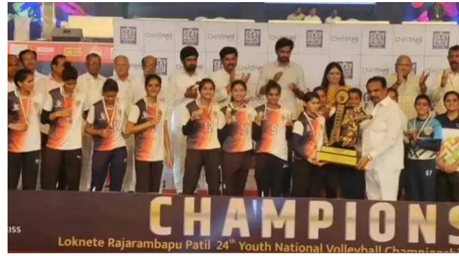
Loknete Rajarambapu Patil 24th Youth National Volleyball Championship

ઈન્ટરનેશનલ કક્ષાએ પોતાનું યોગદાન આપ્યું છે. દેશ અને દુનિયામાં તેના પ્રાંત અને રાજ્યનું નામ રોશન કર્યું છે. કેટલાક પેલાડીઓએ જણાવ્યું હતું કે, કોઈને આશા ન હતી કે આ ટીમે ફાઈનલ મેચમાં મજબૂત ગણાતી ઈતિહાસમાં પ્રથમવાર ગુજરાતની મહિલા ટીમ ચેમ્પિયન બની છે. ટુર્નામેન્ટ દરમિયાન ગુજરાતનું એકહૃદય પ્રભુત્વ જોવા મળ્યું હતું અને પ્રથમ વખત આ દીકરીઓએ નેશનલ યુથ વોલીબોલ ચેમ્પિયનશીપમાં જીત હાંસલ કરી ગુજરાતનું નામ રોશન કર્યું છે. આગામી સમયમાં આ દીકરીઓ ઈન્ટરનેશનલ લેવેલે ગુજરાતનું નામ રોશન કરવાની ઈચ્છા ધરાવે છે. જો ગુજરાતનાં અન્ય ગામોમાં પણ દીકરીઓને આવી રીતે તાલીમ આપવામાં આવે તો તેઓ રાજ્યનું નામ વૈશ્વિક ફલક ઉપર ચમકાવી શકે છે.