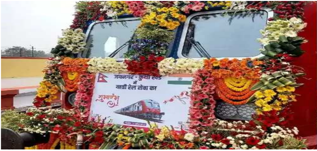
૩૭ એપ્રિલથી શરૂ થશે. જયનગર કુર્થા ભાયા જનકપુર (૩૪.૯ કિમી) રેલવે લાઈન પર સ્થિત તમામ સ્ટેશન અને હોલ્ટ રેલ સેવાના શુભારંભ માટે તૈયાર કરાયું હતું. સ્થાનિક અને નેપાળી નાગરિક ઉદ્ઘાટનની આ ક્ષણની આતુરતાથી રાહ જોઈ રહ્યા હતા. ટ્રેનનું સંચાલન શરૂ થતાં જ

નવીદિલ્હી, તા.૨ આઠ વર્ષ બાદ આજથી ભારત અને નેપાળ વચ્ચે રેલવે સેવા શરૂ થઈ ગઈ છે. આ સાથે બંને દેશોના ઇતિહાસના પાનાઓમાં આજની તારીખ સુવર્ણ અક્ષરોમાં નોંધાયેલી છે. વડાપ્રધાન નરેન્દ્ર મોદી અને નેપાળના પીએમ શેર બહાદુર દેઉબાએ દિલ્હીના હૈદરાબાદ હાઉસથી ટ્રેનને લીલી ઝંડી બતાવી હતી. આ પહેલા બંને દેશોના વડાપ્રધાનોએ બેઠક પણ કરી હતી. આ દરમિયાન બંને દેશોના પ્રતિનિધિમંડળો વચ્ચે વાતચીત પણ થઈ હતી. જો કે, મુસાફરો માટે રેલવે સેવા આવતીકાલે એટલે કે