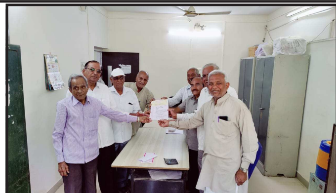
ખાંડ તાલુકા નિવૃત્ત કર્મચારી ચેરીટેબલ ટ્રસ્ટના હોદ્દેદારશ્રીઓ દ્વારા ગુજરાત રાજ્ય નિવૃત્ત કર્મચારી મંડળના આદેશ અનુસાર નિવૃત્ત કર્મચારીઓના પ્રશ્નો બાબતે ફેરરેશન લડનારા મંડાણ કરવાના હોવાથી તાલુકા કક્ષાએ માનનીય મામલતદાર સાહેબશ્રી ને આવેદનપત્ર માનનીય મુખ્યમંત્રી શ્રી ભુપેન્દ્રભાઈ પટેલ ને ઉદ્દેશીને આપવામાં આપેલ હતું.

વેજલપુર વિસ્તારમાં આવેલ ખીજીડીયા હનુમાનજી નાં મંદિરે દર વર્ષે ની માફક ચાલુ સાલે પણ હનુમાન જયંતી નિમિત્તે યજ્ઞ આયોજન કરવામાં આવેલ કમેકાડી બ્રાહ્મણો દ્વારા પુજા અર્ચના કરવામાં આવે જેમાં ભક્તો એ દર્શન નો લાભ લઈ ધન્યતા અનુભવેલ આ મંદિરમાં દર શનિવારે પણ ભક્તો ની ભીડ સવાર સાંજે રહેતી હોય છે.