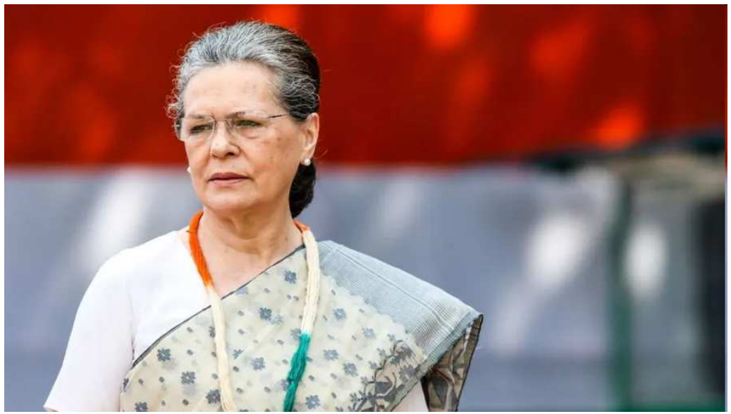
અભિનંદન આપું છે. મને વિશ્વાસ છે કે તે તમામ જાહેર અને રાજનીતિક જીવનમાં કોઈને કોઈ રીતે જોડાયેલા રહેશે અને આપણી પાર્ટીને મજબૂત કરવા માટે કામ કરવાનું જારી રાખશે પાર્ટીથી નારાજ ચાલી રહેલ નેતાઓને સોનિયાએ ઈશારો આપ્યો કે તે તાકિદે અનેક પરિવર્તન કરનાર છે જ્યારે બીજી તરફ વર્કિંગ કમિટીની બેઠકને પણ બોલાવવાની વાત કરી હતી સોનિયાએ કહ્યું કે હું સારી રાતે જાણું છું કે તાજેતરની ચૂંટણી પરિણામોથી અમે કેટલા નિરાશ છે તે ચોક્કસ અને દર્દનાક બંને રહ્યાં છે. કોંગ્રેસે બીજીવાર સુચન સાબળવામાં આવશે જીવતી કરવા માટે અનેક નિર્ણય લેવાની માંગ કરી રહ્યાં છે. જી રૂઝી કહ્યું કે તેમને પાર્ટીને મજબૂત કરવાની બાબતમાં અનેક સુચન મળ્યાં છે અને તે તેના પર કામ કરી રહ્યાં છે. તેમણે કહ્યું કે ચિંતન શિબિર તે જગ્યા છે જ્યાં મોટી સંખ્યામાં પાર્ટીના લોકોના સુચન સાબળવામાં આવશે

જરૂરી ચીજવસ્તીઓના વધતા ભાવ અંગે તેમણે કેન્દ્ર સરકારની ટીકા કરી હતી. પાંચ રાજ્યોમાં તાજેતરમાં યોજાયેલી વિધાનસભા ચૂંટણીમાં કારમી હારનો સામનો કર્યા બાદ કોંગ્રેસ સંસદીય દળની આ પ્રથમ બેઠક છે. પાર્ટીએ આ વર્ષે ગુજરાત અને હિમાચલ પ્રદેશમાં વિધાનસભા ચૂંટણીનો સામનો કરવાનો છે. બીજી તરફ કોંગ્રેસ આ દિવસોમાં આંતરિક વિખવાદનો સામનો કરી રહી છે. એક તરફ મધ્યપ્રદેશના પૂર્વ પ્રદેશ અધ્યક્ષ અરુણ યાદવ નારાજ છે તો બીજી તરફ છત્તીસગઢ અને રાજસ્થાનનો મુદ્દો ઉકેલાયો નથી. તેમણે કહ્યું કે આપણા ચાર ખુબ વરિષ્ઠ અને અનુભવી સાથી તાજેતરમાં રાજ્યસભામાંથી નિવૃત્ત થયા છે. તેમાંથી પ્રત્યેક પોતાના કાર્યકાળ દરમિયાન ખુબ યોગદાન આપ્યું છે. હું તે તમામને