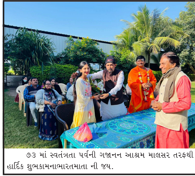
૭૩ માં સ્વતંત્રતા પર્વની ગજનન આશ્રમ માલસર તરફથી હાર્દિક શુભકામનાભારતમાતા ની જય.