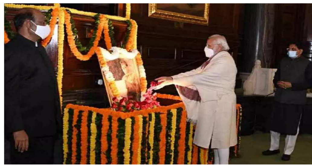
વડાપ્રધાને ટૂવીટ કરીને તેમને શ્રદ્ધાંજલિ આપી હતી. તેમણે લખ્યું કે, 'પરાક્રમ દિવસ પર તમામ

સાહસિક પગલાં તેમને drational Idol બનાવે છે. તેમણે કહ્યું કે નેતાજીના આદર્શો અને બલિદાન દરેક ભારતીયને હંમેશા પ્રેરણા આપતા રહેશે. પીએમ મોદી અને રાષ્ટ્રપતિ રામનાથ કોવિંદ ઉપરાંત મમતા બેનર્જીએ પણ નેતાજી પ્રતિમા તે જ જગ્યાએ હાજર રહેશે. હું ૨૩ જાન્યુઆરીએ નેતાજીની જન્મજયંતિ પર હોલોગ્રામ પ્રતિમાનું અનાવરણ કરીશ. નેતાજી સુભાષ ચંદ્ર બોઝની ૧૨૫મી જન્મજયંતિ પર રાષ્ટ્રપતિ રામનાથ કોવિંદ ઉપરાંત કે ભારત નેતાજીને શ્રદ્ધાંજલિ અર્પે છે. સ્વતંત્ર ભારતના વિચાર પ્રત્યેની તેમની પ્રતિબદ્ધતાને પૂર્ણ કરવા માટે નેતાજીએ લીધેલા