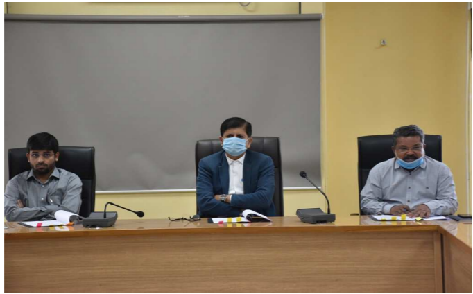
સાફસફાઈ, સહિતના મુદ્દાઓની વિસ્તૃત ચર્ચા કરી હતી.