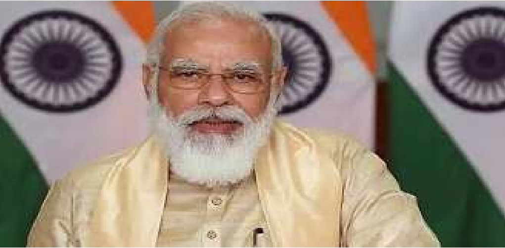
નવીદિલ્હી,તા.૧૨ વડાપ્રધાન નરેન્દ્ર મોદીએ આયોજિત આ ઉત્સવનું ઉદ્ઘાટન કરતાં પીએમ મોદીએ કહ્યું, 'ભારત પાસે બે અમર્યાદિત શક્તિ

છે', એક ડેમોગ્રાફી અને બીજી ડેમોક્રેસી. જે દેશમાં જેટલી યુવાશક્તિ હોય છે તેની શક્તિઓને પણ એટલી જ વિશાળ માનવામાં આવે છે. ભારત પાસે આ બંને શક્તિઓ મોદીએ કહ્યું હતું કે ન્યૂ ઈન્ડિયાનો મંત્ર 'મકાબલો કરો અને જીતો' છે.