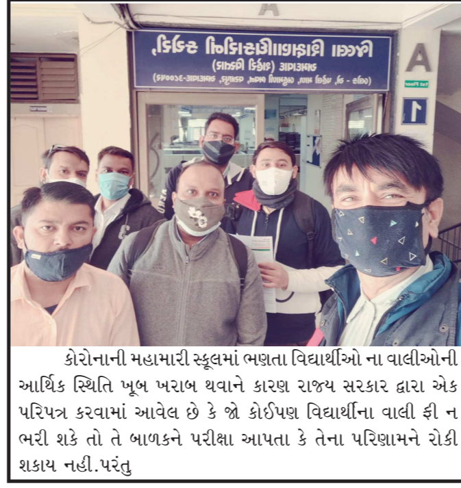
કોરોનાની મહામારી સ્કૂલમાં ભણતા વિદ્યાર્થીઓના વાલીઓની આર્થિક સ્થિતિ ખૂબ ખરાબ થવાને કારણે રાજ્ય સરકાર દ્વારા એક પરિપત્ર કરવામાં આવેલ છે કે જે કોઈપણ વિદ્યાર્થીના વાલી ફી ન ભરી શકે તો તે બાળકને પરીક્ષા આપતા કે તેના પરિણામને રોકી શકાય નહીં. પરંતુ