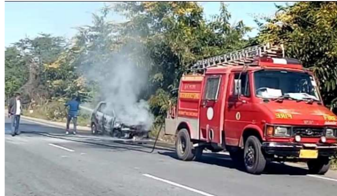
બનાસકાંઠા દાંતા તા. ૧૧ પાલનપુર-અંબાજી હાઈવે પર કારમાં અચાનક આગ લાગતા અફરાતફરી મચી ગઈ હતી. જોકે, પાલનપુર નગર પાલિકાના ફાયર ફાઈટરે આવી આગ પર કાબુ મેળવ્યો હતો. પાલનપુર અંબાજી હાઈવે પર કારમાં શોર્ટ સર્કિટને પગલે આગ લાગી હતી. કારમાં આગ લાગતાં કાર બળી ને ખાખ થઈ ગઈ હતી. ઘટનાની જાણ થતાં પાલનપુર ફાયર ફાયટર દ્વારા આગ પર કાબુ મેળવવાયો હતો. જેના કારણે કારમાં સવાર બે લોકો નો આખા હાનુ બચાવ થયો હતો. આગ લાગવા પાછળ શોર્ટ સર્કિટ હોવાનું મનાઈ રહ્યું છે. અહેવાલ દીલીપ ગોહીલ બનાસકાંઠા