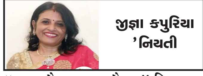
જુજા કપુરિયા 'નિયતી'

મનડા સાથે મનમેળ કરીને નિભાવીશું મિત્રતા, સંબંધોને ધમરોળીને નિભાવીશું મિત્રતા... આજે ભલે જવાબદારી અને પળોજણમાં અટવાયા આપણે, સમય કે સંજોગોને માન આપી નિભાવીશું મિત્રતા.. આજે ભલે ક્યારેક ગમતું અણગમતું છોડવું આપણે, માનસિક સંતુષ્ટિ આપીને નિભાવીશું મિત્રતા... આજે ભલે દૂર રહ્યા એકબીજાથી આપણે, હાકલ પડે હાજર રહીને નિભાવીશું મિત્રતા... આજે ભલે પૈસા કમાવવાની હોડમાં મથ્યા આપણે, તારાં રહસ્યને અકબંધ તિજોરીમાં રાખીને નિભાવીશું મિત્રતા... આજે ભલે એકલપંથે જગજીવતા નીકળ્યા આપણે, તારી ઢાલ બનીને આગળ થઈને નિભાવીશું મિત્રતા.... ખરેખર મિત્રો, એ જ તમારો સાચો મિત્ર છે જે મૂશળધાર વરસાદમાં પણ તમારી આંખમાં આવેલ આંસુને ઓળખી જાય અને સંકટ સમયે ખરી કસોટીમાંથી પાર ઉતરે એ જ તમારો સાચો મિત્ર..