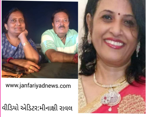
વીડિયો એડિટર:મીનાક્ષી રાવલ