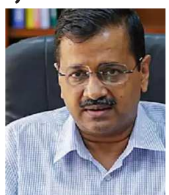
નાયબ મુખ્યમંત્રી મનીષ સિસોદિયાને કોરોના વાયરસના કેસ સતત વધી રહ્યા છે. આ દરમિયાન દિલ્હીના મુખ્યમંત્રી અરવિંદ કેજરીવાલ, બીજેપી નેતા મનોજ તિવારી અને કેન્દ્રીય મંત્રી ડૉ. મહેન્દ્ર નાથ પાંડે પણ કોરોના વાયરસની ઝપેટમાં આવી ગયા છે. હોસ્પિટલે ૫ જાન્યુઆરીથી

નવીદિલ્હી,તા.૪ ઓમિકોનના વધતા જોખમ વચ્ચે, રાષ્ટ્રીય રાજધાની દિલ્હીમાં કોરોના વાયરસ પૂબ જ ઝડપથી ફેલાઈ રહ્યો છે. ત્યારે મુખ્યમંત્રી અરવિંદ કેજરીવાલ પણ કોરોના પોઝિટિવ આવ્યા છે. તેમણે પોતે મંગળવારે સવારે ટૂવીટ કરીને લોકોને આ અંગેની જાણકારી આપી છે. તેઓને કોરોનાના હળવા લક્ષણો છે. કોરોના પોઝિટિવ આવ્યા બાદ અરવિંદ કેજરીવાલે પોતાને ઘરની અંદર ક્વોરન્ટાઈન કરી લીધા છે. તેમણે તેમના સંપર્કમાં આવેલા લોકોને પણ ટેસ્ટ કરાવવા કહ્યું