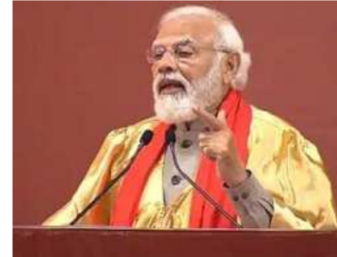
યુગ છે અને મને ખાતરી છે કે તમે આમાં ચોક્કસપણે આગળ આવશો. પહેલા વિચારથી કામ ચલાવવાનું હતું, તો આજે વિચારીને કંઈક કરવું, કામ કરવું અને પરિણામ લાવવાનું છે. આગાઉ સમસ્યાઓથી છુટકારો મેળવવાનો પ્રયાસ થતો હતો તો આજે પ્રશ્નોના નિરાકરણ માટે સંકલ્પ લેવામાં આવે છે.

નવીદિલ્હી,તા.૨૮ દેશની આઝાદીને ૨૫ વર્ષ પૂરા થયા, ત્યાં સુધીમાં આપણે આપણા પગ પર ઊભા રહેવા માટે ઘણું બધું કરી લેવું જોઈતું હતું. ત્યારથી ઘણું મોડું થઈ ગયું છે, દેશ ઘણો સમય ગુમાવ્યો છે. વચ્ચે બે પેઢીઓ વીતી ગઈ એટલે આપણે બે પગ પણ ગુમાવવી નથી. વડાપ્રધાને કહ્યું કે આવનારા ૨૫ વર્ષમાં તમારે ભારતની વિકાસ યાત્રાની ભાગડોર સંભાળવી પડશે. જ્યારે તમે તમારા જીવનના ૫૦ વર્ષ પૂરા કરશો, ત્યારે તમારે તે સમયે ભારત કેવું હશે તે માટે તમારે અત્યારથી જ કામ કરવું પડશે. IIT કાનપુરના ૫૪માં દીક્ષાંત સમારોહમાં સીએમ યોગીએ કહ્યું કે આત્મનિર્ભર ભારતના વિઝનને સાકાર કરવા માટે આ દેશે ૨૦૨૦માં નવી રાષ્ટ્રીય શિક્ષણ નીતિ લાગુ કરી છે. IIT કાનપુરે રાજ્ય સરકાર સાથે પરસ્પર સહયોગના ઘણા ઉદાહરણો રજૂ કર્યા છે. વડાપ્રધાન નરેન્દ્ર મોદી ઉત્તર પ્રદેશના કાનપુર શહેરના પ્રવાસે છે. આ અંતર્ગત, પીએમ ઈન્ડિયન ઈન્સ્ટિટ્યૂટ ઓફ ટેકનોલોજી, કાનપુરના દીક્ષાંત સમારોહમાં હાજરી આપવા પહોંચ્યા હતા. આ દરમિયાન તેમની સાથે રાજ્યના મુખ્યમંત્રી યોગી આદિત્યનાથ પણ હાજર છે. આ સાથે પીએમ કાનપુર મેટ્રો રેલ પ્રોજેક્ટના સંપૂર્ણ સેક્શનનું અને બીના-પનકી મલ્ટિપ્રોડક્ટ પાર્થપાલઠન પ્રોજેક્ટનું પણ ઉદ્ઘાટન કરશે. વડાપ્રધાન કાર્યાલય અનુસાર, શહેરી ગતિશીલતામાં સુધારો એ PM મોદીના મુખ્ય ફોકસ ક્ષેત્રોમાંનો એક છે. વિદ્યાર્થીઓને સંબોધતા પીએમએ કહ્યું કે ૧૯૩૦ના યુગમાં જેઓ ૨૦-૨૫ વર્ષના હતા, તેમની ૧૯૪૭ સુધીની સફર અને