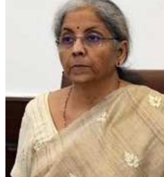
પ્રોત્સાહન આપવા માટે પગલાંની જરૂર છે. બજેટ પહેલા વડાપ્રધાન મોદીએ ઈન્ડસ્ટ્રી લીડર્સનો તેમના ઈનપુટ્સ અને સૂચનો માટે આભાર માન્યો હતો. તે જ સમયે તેમણે પ્રોત્સાહનો જેવી નીતિઓનો સંપૂર્ણ ઉપયોગ કરવા પ્રોત્સાહિત કર્યા. તેમણે કહ્યું કે જે રીતે દેશ

નવીદિલ્હી,તા.૨૨ નાણામંત્રી નિર્મલા સીતારમણ ૧ એપ્રિલ ૨૦૨૨ થી શરૂ થતા આગામી નાણાકીય વર્ષ માટે ૧ ફેબ્રુઆરી ૨૦૨૨ ના રોજ આગામી બજેટ રજૂ કરવા જઈ રહ્યા છે. બીજી તરફ વડા પ્રધાન નરેન્દ્ર મોદીએ ભારતને વધુ આર્થિક રોકાણ સ્થળ બનાવવા માટે જરૂરી સુધારા અંગે સૂચનો મેળવવા અગ્રણી ખાનગી ઈક્વિટી/વેન્ચર કેપિટલ પ્લેયર્સ અને કંપનીઓના ડેઈને મળ્યા છે. આ બજેટ એવા સમયે આવી રહ્યું છે જ્યારે કોરોના વાયરસના કારણે અર્થવ્યવસ્થા પર અસર પડી રહી છે. આવી સ્થિતિમાં આર્થિક વિકાસને