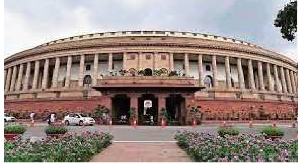
લખીમપુર ખીરી કેસમાં વિપક્ષ કેન્દ્રીય ગૃહ રાજ્ય મંત્રી અજય મિશ્રા ટેનીના રાજીનામાની ચર્ચાથી ભાગી રહ્યું છે. ટેનીના રાજીનામાને લઈને લોકસભા અને રાજ્યસભાની કાર્યવાહી ઘણી વખત સ્થગિત કરવામાં આવી હતી. જો કે, વિપક્ષના હોબાળા વચ્ચે પણ સદનમાં કેટલાય બિલ મોદી સરકારે પાસ કરી નાખ્યા હતા.

અજય મિશ્રા ટેનીના રાજીનામાની ચર્ચાથી ભાગી રહ્યું છે. ટેનીના રાજીનામાને લઈને લોકસભા અને રાજ્યસભાની કાર્યવાહી ઘણી વખત સ્થગિત કરવામાં આવી હતી. જો કે, વિપક્ષના હોબાળા વચ્ચે પણ સદનમાં કેટલાય બિલ મોદી સરકારે પાસ કરી નાખ્યા હતા.