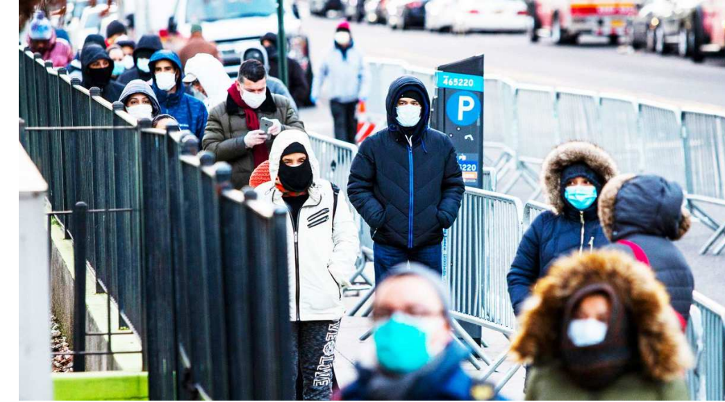
૪૨,૪૯૭,૩૪૮ થઈ છે જ્યારે મરણાંક ૬,૮૫,૨૪૨ થયો છે. દરમિયાન કોરોનાના નવા કેસો સતત વધી રહ્યા હોવાને પગલે બાઈડન વહીવટીતંત્ર ઈન્ટરનેશનલ મુલાકાતીઓ માટે કોન્ટેક્ટ ટ્રેસિંગ લાગુ પડે તેવી શક્યતા હોવાનું બ્લાઈટ હાઉસના સૂત્રોએ જણાવ્યું હતું.

વોશિંગ્ટન, તા.૧૭ કોરોનાની રસી સૌપ્રથમ વિકસાવવાનું બહુમાન ધરાવતાં રશિયામાં ૩૦ ટકા કરતાં ઓછા લોકોએ કોરોનાની રસીના બંને ડોઝ મેળવ્યા છે. ૧૪૫ મિલિયનની વસ્તી ધરાવતાં દેશમાં ૭.૨ મિલિયન લોકોને કોરોનાનો ચેપ લાગેલો છે અને કોરોનાના કારણે ૧,૯૫,૮૩૫ જણાના મોત થયા છે. દુનિયામાં કોરોનાના નવા ૨,૪૬,૨૯૩ કેસો નોંધાવાને પગલે કોરોનાના કુલ કેસોની સંખ્યા વધીને ૨૨૭,૪૭૧,૬૭૭ થઈ હતી જ્યારે ૪,૫૭૮ જણાના મોત થવાને પગલે કોરોનાનો કુલ મરણાંક ૪૬,૭૭,૦૮૦ થયો હતો. યુએસમાં ફરી કોરોનાના દૈનિક કેસોમાં વધારો નોંધાયો છે. ગઈકાલે યુએસએમાં કોરોનાના નવા ૧,૬૪,૫૦૯ કેસો નોંધાયા હતા અને ૨૨૮૨ જણાના મોત થયા હતા. આજે પણ સાડા સત્તર લાખ નવા કેસો અને ૨૧૯ જણાના મરણ નોંધાઈ ચૂક્યા છે. યુએસએમાં કોરોનાના કુલ કેસોની સંખ્યા