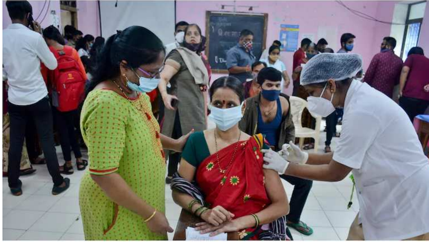
માટે પણ ખાસ છે કારણકે આ જ આવે ૨૦ વર્ષ પૂરા થાય છે. ૭ વર્ષ તેમને સક્રિય રાજકારણમાં આક્ટોબર ૨૦૦૧ના રોજ તેઓ ગુજરાતના મુખ્યમંત્રી બન્યા હતા. મુખ્યમંત્રી અને વડાપ્રધાનના પદ પર રહ્યા છે.

આવે છે કે, શુક્રવારે અંદાજે દોઢ કરોડ ડોઝનો રેકોર્ડ બનાવવામાં આવી ગયો છે. પ વાગ્યા દરમિયાન ૨ કરોડ લોકો એ વેક્સિનેશન લઈ લીધાની માહિતી કેન્દ્ર સરકાર દ્વારા જાહેર કરેલ કોવિન વેબસાઈટ પરથી મળી હતી. આવી આશા એટલા માટે છે કારણકે દેશમાં અંદાજે એક લાખ સાઈટ પર વેક્સિનેશન કાર્યક્રમ શરૂ કરવામાં આવ્યા છે. વડાપ્રધાન નરેન્દ્ર મોદીનો આ જન્મ દિવસ એટલા