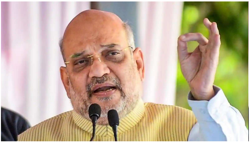
તેમના સંબોધનમાં કહ્યું હતું કે, સહકારી મંડળીઓને લોકો કોઈ પરિપત્ર નથી જોતા, કોઈ પણ મુશ્કેલી આવતા મદદ માટે તૈયાર થઈ જાય છે. સહકારી મંડળીઓ પૂર હોય, સાઈકલોના હોય કઈ પણ

કરશે, તેમને આગળ વધારશે. તેમને આધુનિક બનાવશે, તેમના પારદર્શક બનાવશે. દેશમાં આજે પહેલીવાર સહકારી સંમેલનનું આયોજન કરવામાં આવ્યું છે. દિલ્હીના ઈન્દિરા ગાંધી ઈન્ડોર સ્ટેડિયમમાં સહકારી સંમેલનનું આયોજન કરવામાં આવ્યું હતું. આ સંમેલનનમાં કેન્દ્રીય ગૃહ અને સહકારી મંત્રી અમિત શાહ હાજર રહ્યા હતા. આ દરમિયાન તેમણે કહ્યું કે, આપણે કામનો વિસ્તાર વધારવાનો છે. તેમણે કહ્યું કે, ભારતના સંસ્કારોમાં સહકારની ભાવના છે. તેમણે કહ્યું કે, ગરીબો અને પછાતવર્ગના વિકાસ માટે સહકારી મંડળીઓ છે. અમિત શાહે