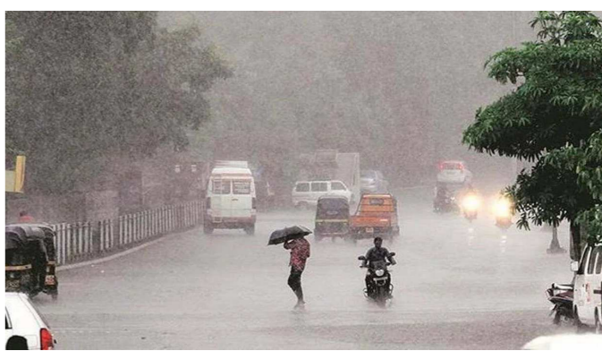
કરવામાં આવ્યા હતા. સુરત શહેર સાથે જિલ્લામાં ભારે વરસાદને લઈ પાડીઓના લેવલમાં વધારો થતાં શહેરના માથે પાડીપૂરનું સંકટ તોળાઈ રહ્યું છે. ઉમરપાડામાં ૨૪ કલાકમાં ૮ ઈંચ વરસાદ નોંધાયો છે. જિલ્લામાં ભારે વરસાદથી શહેરમાંથી પસાર થતીઓ પાડીઓના સ્તરમાં વધારો થઈ રહ્યો છે. બીજી તરફ, શહેરમાં સરેરાશ ૨.૭ ઈંચ વરસાદ થયો છે. ભેદવાડ પાડી ભયજનક સપાટી દ.૭૫ મીટરની લગોલગ છે, જ્યારે મીઠીપાડી ઓવરફ્લો થઈ શકે છે. પાડીપૂરના સંકટથી પાલિકાનું તંત્ર એલર્ટ થઈ ગયું છે. ઉકાઈની સપાટી જાળવી રાખવા માટે કેમમાંથી ૨ લાખ પાણી છોડાઈ રહ્યું છે, જેથી તાપી નદી બે કાંઠે વહી રહી છે, જેથી નીચાણવાળા વિસ્તારોને એલર્ટ કરી દેવામાં આવ્યાં છે.

બાદ નબળું પડ્યું હતું અને હવે અરબ સાગર તરફ આગળ વધી રહ્યું છે. જો કે ગુલાબ નબળું પડતા જ ગુજરાત પર હવે શાહિન વાવાઝોડું સંકટ તોળાઈ રહ્યું છે. હવામાન વિભાગના જણાવ્યા હોવાથી ભારે પવન ફૂંકાવાની શક્યતાઓ છે. જેથી માછીમારોને ત્રણ દિવસ સુધી દરિયો નહીં ખેડવા સૂચના આપવામાં આવી છે. રાજ્યમાં દ જિલ્લામાં ઓરેન્જ એલર્ટ અને ૨૦ જિલ્લામાં આજે યેલો એલર્ટ આપવામાં આવ્યું છે. રાજ્યમાં આગામી પાંચ દિવસ ભારે વરસાદ થવાની પણ આગાહી કરવામાં આવી છે. આજે સવારથી જ અમદાવાદમાં પવન ફૂંકાયો છે. તમામ જિલ્લા વહીવટી તંત્રને સ્ટેન્ડ બાય રાખવામાં આવ્યાં છે. 'ગુલાબ' વાવાઝોડું ઓડિશાના સાગરકાંઠે બે દિવસ પહેલાં ટકરાયા