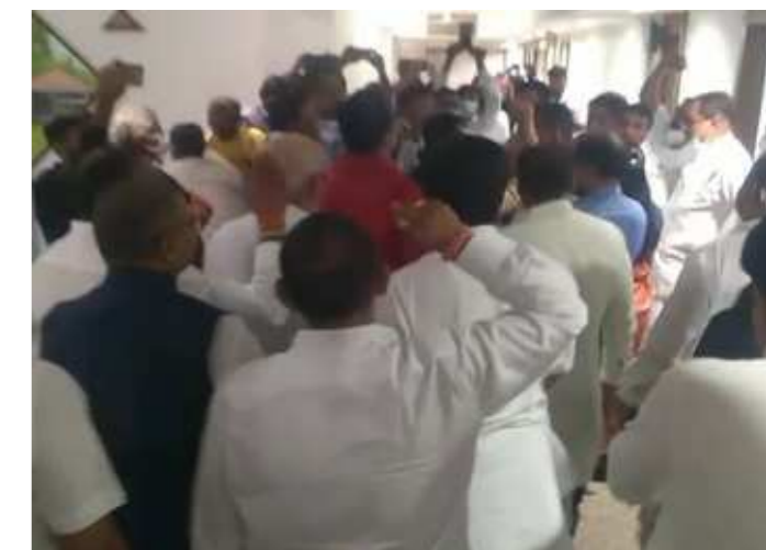
બંદોબસ્ત ગોઠવવામાં આવ્યો છે. વિધાનસભામાં ચાલતી પ્રશ્નોત્તરી તમામ ચેમ્બરની અંદર બેસીને લોકો સાંભળી હતી.

ધારાસભ્યોને શીખવાડ્યું હતું. ગૃહ શરૂ થયા બાદ સીઆર પાટિલે પ્રેક્ષક ગેલેરીમાંથી નવા મંત્રી મંડળની કામગીરી નિહાળી હતી. પાટિલની સાથે ૪ મહામંત્રીઓ પણ હાજર રહ્યા હતા. આજે જયારે ડ્રગ્સના લઈને પક્ષમાં પરેશ ધાનાણીએ ઉગ્ર વાત કરી ત્યારે એક સમયે વરિષ્ઠ નેતાઓની કમી ભાજપના નવા મંત્રીઓમાં દેખાવ મળી હતી. વિધાનસભા ગૃહની બહાર લોખીમાં પક્ષ અને વિપક્ષના અનેક કાર્યકરો અને મુલાકાતીઓ આવ્યા હતાં. લોખીમાં પણ લોકોની વધુ અવરજવરના કારણે પોલીસ