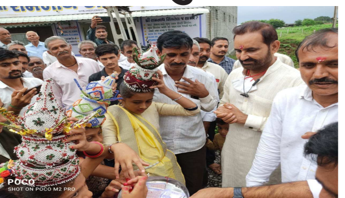
શક્તિસિંહ ગોહિલને શાસ્ત્રીય શરણાગતિ સ્વાગત કરવામાં આવ્યું હતું.

ન્યાય યાત્રા માં તળાજા આવી રહેલા કોંગ્રેસનાં વરિષ્ઠ આગેવાન સાંસદ શક્તિસિંહ ગોહિલ આજે તળાજા જઈ રહ્યા હતા, ત્યારે વેળાવદર, ગ્રાપજ અને તળાજા માં ભવ્ય સ્વાગત કોંગ્રેસ દ્વારા કરવામાં આવ્યું હતું. ઘોડી ઉપર બેઠામાડી વાજતે ગાજતે સ્વાગત અને સન્માન વ્યક્તિને શોભે તેવું બહુમાન તળાજા કોંગ્રેસ દ્વારા કરવામાં આવ્યું હતું. રાજ્યસભા નાં સાંસદ બન્યા પછી, કોરોના નાં કારણે ખૂબ લાંબા સમયે શ્રી શક્તિસિંહ ગોહિલ નું ભાવનગર જિલ્લામાં આગમન એક નવી ઊર્જા અને