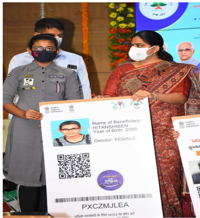
રાજ્યના ગરીબ અને જરૂરિયાતદ લાભાર્થીઓને આરોગ્ય સેવાઓ સરળતાથી અને નિ:શુલ્ક મળી રહે તે માટે PMJAY-MA કાર્ડના લાભથી લાભાન્વિત કરવા સરકાર દ્વારા ૧૦૦ દિવસ “આપ કે દાર આયુષ્યમાન” મેગાડ્રાઈવ યલાવવામાં આવશે. આ મેગા ડ્રાઈવમાં

રાજ્યના નગરો-મહાનગરો ઉપરાંત ગ્રામ્ય સ્તરે સી.એચ.સી. અને પી.એચ.સી. સેન્ટર ખાતે પણ નાગરિકોને PMJAY-MA કાર્ડ આપવામાં આવશે. સરકારી હોસ્પિટલોમાં સ્ત્રી-સ્ત્રી કાર્ડ અંતર્ગત સ્વાસ્થ્ય સેવાઓ સરળતાથી મળી રહે તે માટે ગ્રીન કોરિડોરની પણ વ્યવસ્થાઓ ઉભી કરવામાં આવનાર છે. જે અંતર્ગત હોસ્પિટલના પ્રવેશદ્વાર / ઓ.પી.ડી. ખાતે ક્લિયર હેલ્થ ડેસ્ક ફરજિયાત પહેલે કાર્યરત કરીને દર્દીઓને મુંઝવતા પ્રશ્નોના સ્થળ પર ત્વારએ નિરાકરણ આવે તે માટેના પ્રયાસો હાથ ધરવામાં આવશે. દરેક સરકારી હોસ્પિટલમાં આ યોજનાના લાભાર્થી માટે અલગ કેસબારી / અલગ રજીસ્ટ્રેશન સિસ્ટમ ઉભી કરવામાં આવશે. લાભાર્થીઓને હોસ્પિટલ ખાતેના પ્રવેશથી લઈ સારવાર