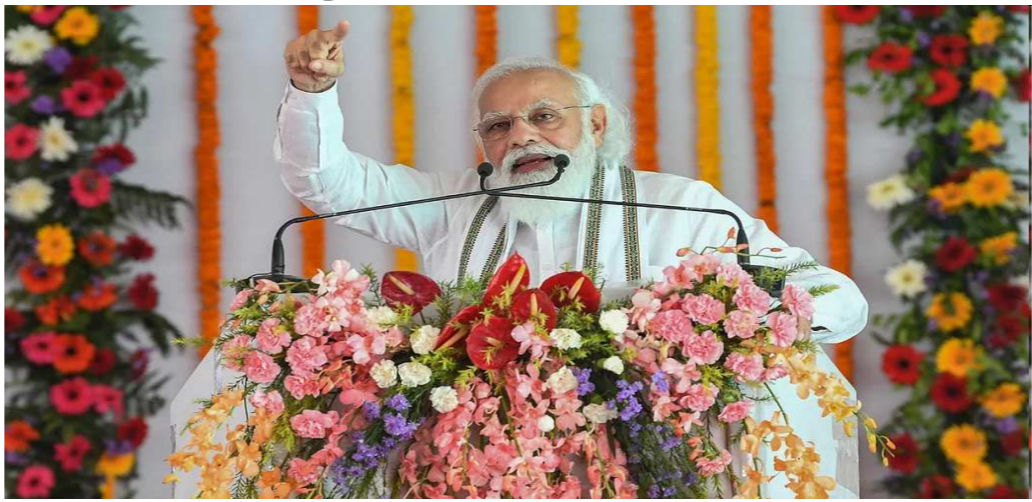
મોકલવામાં પણ ડર લાગતો હતો. લોકો પલાયન કરી રહ્યા હતા. આજે ગુનેગારો કોઈ પણ અપરાધ કરતા સો વખત વિચારે છે. તેમણે કહ્યું હતું કે, ડાનબંધ રિફેન્સ કંપનીઓ યુપીમાં ફેક્ટરીઓ લગાવવા માટે તૈયાર છે. યુપીમાં દુનિયાભરના રોકાણકારો રોકાણ કરવા આવી રહ્યા છે. યુપીમાં આ પ્રકારનો માહોલ રાજ્ય અને કેન્દ્રમાં ડબલ એન્જિનની સરકારને આભારી છે.

આવી રહી છે. તેમણે કહ્યું હતું કે, ૨૦૧૭ પહેલા ગરીબોની દરેક યોજનામાં રોડ નાંખવામાં આવતા હતા. એક એક યોજના લાગુ કરવા માટે ડાન વખત પત્ર લખવા પડતા હતા. યુપીના લોકોને યાદ હશે કે પહેલા કેવા ગોટાળા થતા હતા. આજે યોગી સરકાર ઈમાનદારીથી વિકાસ કરી રહી છે. પીએમ મોદીએ કહ્યું હતું કે, એક સમય એવો હતો જ્યારે ગુંડાઓ, માફિયાઓ શાસન ચલાવતા હતા. આજે ગુંડાઓ અને માફિયાઓ જેલના સળિયા પાછળ છે. પશ્ચિમ યુપીના લોકોને યાદ દેવડાવવા માંગુ છે કે, અહીંના લોકોને ગુંડાઓના ડરથી પોતાની દીકરીઓને સ્કૂલ અને કોલેજ