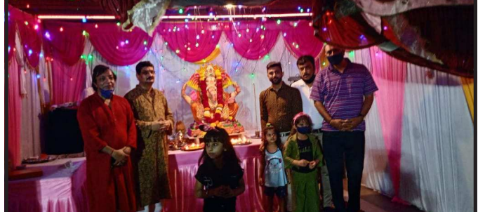
દર વર્ષે ની માફક ચાલુ વર્ષે પણ ઈન્દ્ર પ્રસ્થ પ પ્રહલાદ નગર વિસ્તારમાં સાવે જનિક ગણેશ ઉત્સવ મનાવવા સોસાયટીમાં ગણપતિ બાપ્પા મોરિયા ના નાદ સાથે ફેરવવામા આવેલ ત્યારબાદ નિજ સ્થાન ઉપર સ્થાપના કરી સવાર સાંજ પૂજા અચેના આરતી અને થાળ પ્રસાદ વહેંચવામાં આવે છે

ગાંધીનગર,તા.૧૧ મોબાઈલનો છે. વિદ્યાર્થીઓથી લઈને મોટેરાઓને મોબાઈલનું વળગણ લાગ્યું છે. પરંતુ અંગુઠો અડાડવાથી કારકિર્દી બનવાની નથી, પરંતુ તેનાથી દુર રહેવાથી કારકિર્દી બનશે. જિલ્લા પોલીસ વડાની કચેરીમાં આત્મહત્યા કરતા લોકોને અટકાવવા માટે જીવન આસ્થા હેલ્પલાઈન શરૂ કરાયેલી છે. અત્યાર સુધી ૮૦ હજાર લોકોએ આત્મહત્યાનો વિચાર આવ્યા બાદ ફોન કર્યો છે. ત્યારે આજથી ૭મા વર્ષમાં પ્રવેશ કરતી હેલ્પલાઈનના કાર્યક્રમ પ્રસંગે કાઉન્સિલરોએ વિદ્યાર્થીઓને સંબોધતા કહ્યું હતું કે, દેશની અનેક સેલીબ્રિટીઓનો અભ્યાસ ઓછો છે, અનેકવાર તેઓ નિષ્ફળ રહ્યા છે, પરંતુ તેમને હિંમત હારી નથી. તમે અભ્યાસમાં નિષ્ફળ જાઓ તો હિંમત હારશો નહિ, જીવનમાં અનેક તકો આવે છે, જે યોગ્ય સમયે ઝડપી લેતા સફળતા મળે છે. ૧૦ સપ્ટેમ્બર ૨૦૧૫માં જીવન આસ્થા હેલ્પલાઈનનો શુભારંભ કરાયો હતો. જેને આજે ૬ વર્ષ પુરા થતા ૭મા વર્ષમાં પ્રવેશ કર્યો હતો. સમગ્ર દુનિયામાં ૧૦મી સપ્ટેમ્બરના રોજ વિશ્વ આત્મહત્યા નિવારણ દિવસ પણ મનાવાય છે.