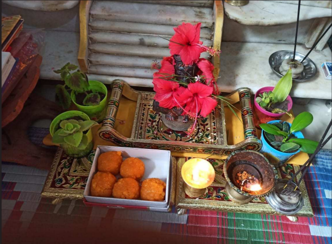
ઘરના ગણેશ ના દર્શન