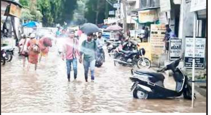
ગુજરાતમાં મેઘમહેર વચ્ચે ગાંધીનગરના દહેગામમાં ડેર-ડેર પાણી ભરાયા જેના કારણે રસ્તાઓ જળબંબાકાર થઈ ગયા હતા. દહેગામ તાલુકાના ગામોમાં તેમજ શહેરમાં વિજળીના કડાકા સાથે ધોધમાર વરસાદ એકથી દોઢ કલાકના વરસાદમાં ત્રણ ઈંચ જેટલો વરસાદ જેના કારણે લાઈટો ડુલ થઈ ગઈ હતી.