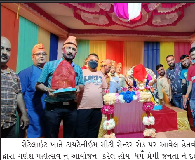
સેટેલાઈટ ખાતે ટાયટેનીઈમ સીટી સેન્ટર રોડ પર આવેલ હેતવી ટાવર પાસે સેટેલાઈટ યુવક મંડળ દ્વારા ગણેશ મહોત્સવ નું આયોજન કરેલ હોય ધર્મ પ્રેમી જનતા ને દર્શન માટે હાર્દિક આમંત્રણ છે