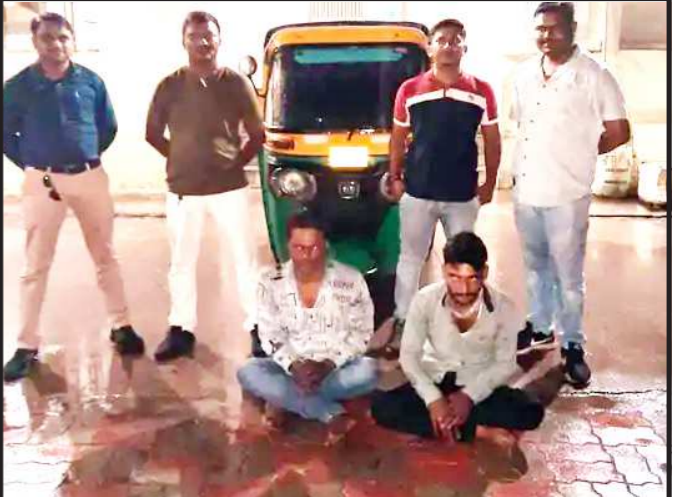
ગાંધીનગરના કલોલમાં રિક્ષામાં મુસાફરના સ્વાંગમાં બેસી લોકોને લુંટતા ૨ શખ્સની ધરપકડ કરવામાં આવી હતી આ આરોપીઓ ગાંધીનગરના કલોલ તાલુકાના ધમાસણા ગામથી મંજુરી કામ કરતા પરપ્રાંતિયો રિક્ષામાં બેસી કામ અર્થે બહાર જતા હતા તે દરમ્યાન રિક્ષામાં બેઠેલા શખ્સ દ્વારા નજર ચુકવી તેમનું પાકિટ દસ્તાવેજ સાથે રોકડ રકમ ચોરી ગયા હતા. ત્યારબાદ ફરિયાદ થતાં આ બંને આરોપીને મુદામાલ સાથે પોલીસે પકડી લીધા હતા.

ઉકેલ આવ્યો અને કૃષિ અને સંલગ્ન વ્યવસાયોમાં સમૃદ્ધિ આવી, જેને ગુજરાતના ગ્રામ્ય અર્થતંત્રની કાયાપલટ થઈ છે. શ્રી નીતિનભાઈએ વિરમગામ ખેતીવાડી ઉત્પન્ન બજાર સમિતિના સંચાલન-મંડળને અભિનંદન પાઠવતા કહ્યું કે, નવી ખેતીવાડી ઉત્પન્ન બજાર સમિતિ ૧૧ વીધામાં આકાર પામશે, જેના કારણે ખેડૂતોને વધુ સારી સુવિધાઓ પ્રાપ્ત થશે. ખેતીવાડી ઉત્પન્ન બજાર સમિતિના મહત્વને રેખાંકિત કરતા નાયબ મુખ્યમંત્રીશ્રીએ કહ્યું કે, આ સહકારી વ્યવસ્થાના કારણે ખેડૂતોના માલની હરાજ થતા સારા ભાવ મળે છે, સાચો તોલ થાય છે અને ખેડૂતને તરત જ નાણા મળે છે જેના પરિણામે ખેડૂત વધુ ખમીરવંતો બન્યો છે. નાયબ મુખ્યમંત્રીશ્રીએ આ અવસરે તેમના સહકારીક્ષેત્રના સંસ્મરણો તાજ કરતા કહ્યું કે, હું છેલ્લા ૩૭ વર્ષથી કડી માર્કેટયાઈમાં સભ્ય હોવાના કારણે મને ખેતી- ખેડૂતની સમસ્યાઓની સારી પેઠે જાણ છે. તેમણે કહ્યું કે, વિરમગામ ખેતીવાડી ઉત્પન્ન બજાર સમિતિ ગુજરાતની સૌથી જૂની ખેતીવાડી ઉત્પન્ન બજાર સમિતિ પૈકીની એક છે, અને આ સમિતિએ કરેલી પ્રગતિનો મને વિશેષ આનંદ છે. નાયબ મુખ્યમંત્રીશ્રીએ આ પ્રસંગે ખેતીવાડી ઉત્પન્ન બજાર સમિતિ સુધી સરળતાથી પહોંચી શકાય તે માટે નવો રોડ મંજૂર કરવાની પણ જાહેરાત કરી હતી. તેમણે ઉપસ્થિત સભાસદોને ગુજરાત સરકારની કૃષિ સંલગ્ન યોજનાઓનો લાભ લેવા પણ અનુરોધ કર્યો હતો. નાયબ મુખ્યમંત્રીશ્રીએ ભારત સરકારે કૃષિ પેદાશોના ટેકાના ભાવે ખરીદીમાં કરેલી જાહેરાતનો ઉલ્લેખ કરતાં કહ્યું કે, ગુજરાત સરકાર ઝડપથી તેનું અમલીકરણ કરશે. નાયબ મુખ્યમંત્રીશ્રીએ આ અવસરે રોજગાર-સર્જન સંદર્ભે વાયજન્ટ ગુજરાતનું ઉદાહરણ