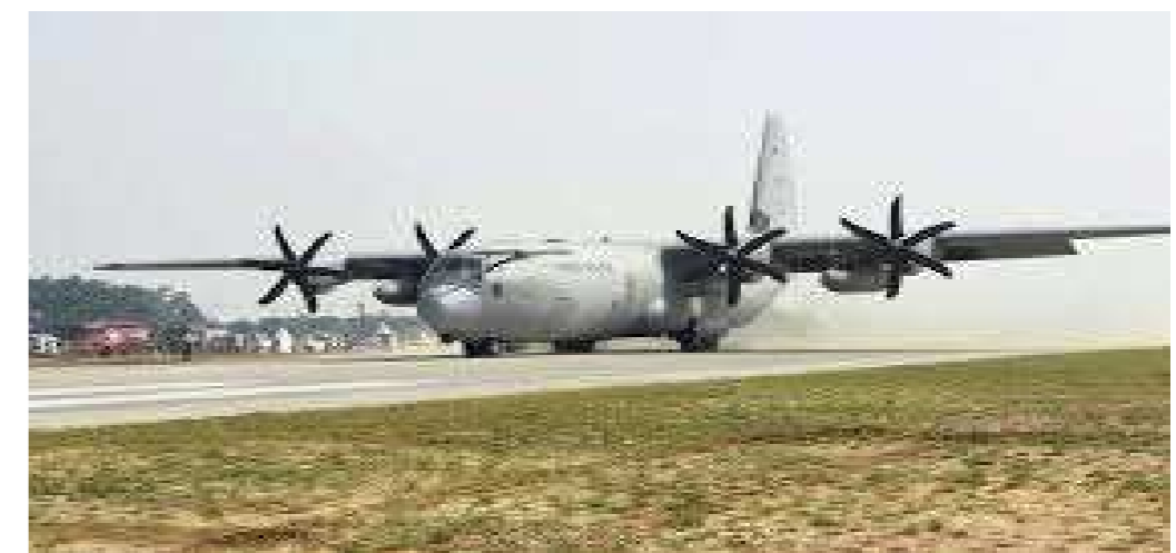
શિવસાગર પાસે પસંદગી થઈ ગઈ છે. ટેન્ડર થશે. બરકાથાટ પાસે લોકેશન ફાઈનલ છે, ટેન્ડર થશે. નૌગાંવ સેનબોગ માર્ગ એનએચ ૨૭નું ટેન્ડર થશે. ખગડપુર-કંજવર માર્ગમાં સાઈટ વિઝિટ થશે. દેશ પર આવનારા સમયમાં યુદ્ધ જેવી સ્થિતિને પહોંચી વળવા કેન્દ્ર સરકાર દ્વારા આગોત્તરી તૈયારીઓ થઈ રહી છે. જે આધુનિક, વિકાસશીલ અને દેશની પ્રજાને ઉપયોગી, સુરક્ષામાં વધારો કરનારી હશે.

ઓર્ડર થઈ ગયો છે. જમીન અધિકારણ ન થયું હોવાથી કામ નથી થઈ રહ્યું. ભુજ-અંજાર માર્ગમાં સાઈટ વિઝિટ થશે. સુરત-મુંબઈ માર્ગ પર સાઈટ વિઝિટ થશે. નેલ્લોર પાસે નિર્માણ કાર્ય ચાલી રહ્યું છે. વિજયવાડા-અંગોરમાં નિર્માણ કાર્ય ચાલુ છે. રાજમુંદરી-વિજયવાડા માર્ગમાં સાઈટ વિઝિટ થશે. પુડુચેરીમાં ટેન્ડર થઈ ગયું છે. જમીન અધિકારણ ન કરવા દીધું. મદુરાઈ માર્ગમાં સાઈટ વિઝિટ થશે. બાલાસુર-ખડગપુરમાં કામ ચાલી રહ્યું છે. ડિગના પાસે સાઈટ વિઝિટ થશે. ઈસ્લામપુર-કિશનગંજ પાસે સાઈટ વિઝિટ થશે. જોરહાટમાં