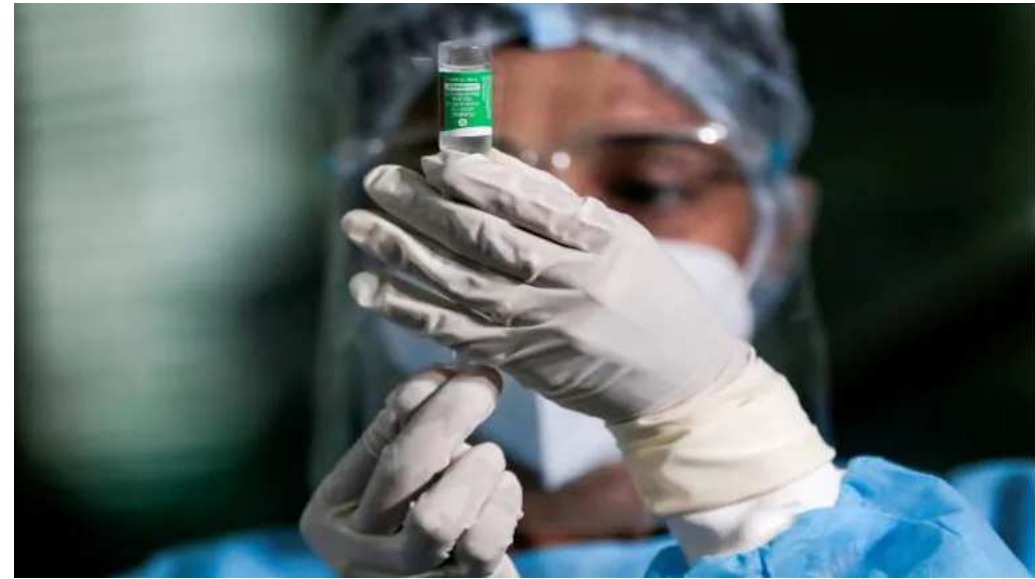
અપાઈ ચૂકી છે. જે બાદ બીજા નંબર મહારાષ્ટ્ર છે, જ્યાં ૫ કરોડથી વધુ લોકોને વેક્સિન અપાઈ છે. ત્રીજા નંબર પર ગુજરાત છે, જ્યાં ૪.૦૭ કરોડ લોકોને રસી આપવામાં આવી છે. ૩.૮૪ કરોડ સાથે મધ્યપ્રદેશ રાજ્યના છે. ચોથા સ્થાને અને પાંચમા ક્રમે ૩.૮૦ કરોડ લોકો સાથે રાજસ્થાન છે.

છેલ્લા ૨૪ કલાકમાં દેશભરમાં અપાધેલી ૮૮.૧૩ લાખ રસી બાદ હવે દેશમાં ૫૫.૪૭ કરોડ લોકોને વેક્સિન અપાઈ ચૂકી છે. જેમાંથી ૪૩.૧૨ કરોડ લોકોને પ્રથમ ડોઝ અપાયો છે અને ૧૨.૩૫ કરોડ લોકોને બંને ડોઝ લાગી ચૂક્યાં છે. વાસ્થ્ય મંત્રાલયના આંકડા અનુસાર, દેશભરમાં અત્યાર સુધી ઉત્તર પ્રદેશમાં સૌથી વધુ લોકોને વેક્સિન આપવામાં આવી છે. ઉત્તર પ્રદેશમાં ૫.૯૮ કરોડ લોકોને રસી