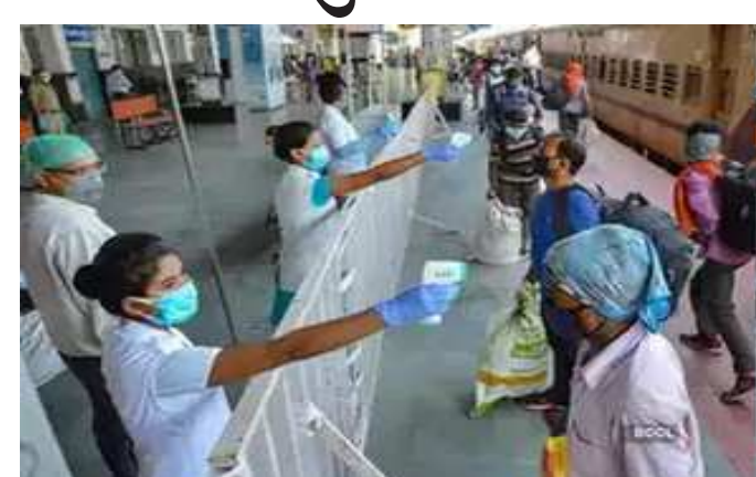
કેન્દ્રીય સ્વાસ્થ્ય મંત્રાલયે જણાવ્યું કે, રાજ્યો, કેન્દ્રશાસિત પ્રદેશો અને ખાનગી હોસ્પિટલોની પાસે અત્યારે પણ કોરોના રસીના ૩ કરોડથી વધારે ડોઝ ઉપલબ્ધ છે. રાજ્યો તેમજ કેન્દ્રશાસિત પ્રદેશોને તમામ રજીસ્ટર્ડ અત્યાર સુધી ૪૮,૪૮,૮૮,૫૫૦ ડોઝ ઉપલબ્ધ કરાવવામાં આવ્યા છે, તથા તેમને અત્યારે વધુ ૮,૦૪,૨૨૦ ડોઝ મોકલવાની પ્રક્રિયા ચાલી રહી છે. આ સાથે જ આઈસીએમઆરએ જણાવ્યું કે, દેશમાં રવિવારના ૧૪,૨૮,૮૮૪ સેમ્પલ્સનું ટેસ્ટિંગ થયું. અત્યાર સુધી દેશમાં ૪૬,૮૬,૪૫,૪૮૪ની તપાસ થઈ ચૂકી છે. કેરળમાં કોવિડ-૧૯ના ૨૦,૭૨૮ નવા કેસ સામે આવ્યા છે, ત્યારબાદ કુલ સંક્રમિતોની સંખ્યા વધીને ૩૪,૧૧,૪૮૮ થઈ ગઈ છે અને ૫૬ દર્દીઓના મોત થયા બાદ મહામારીથી મરનારાઓની સંખ્યા વધીને ૧૬,૮૩૭ થઈ ગઈ છે. કેરળ સરકારે આની જાણકારી આપી. કેરળ સરકાર પ્રમાણે, આજે સતત છઠ્ઠા દિવસે જ્યારે કેરળમાં કોવિડ-૧૯ના ૨૦ હજારથી વધારે કેસ સામે આવ્યા છે. રાજ્યમાં ૨૭ જુલાઈથી અત્યાર સુધી સંક્રમણના ૧,૨૮,૩૭૩ કેસ સામે આવ્યા છે.

ન્યુ દિલ્હી, તા.૨૧ દેશમાં કોરોના કેસોમાં ઉછાળો આવ્યો છે. ભારતમાં સતત છઠ્ઠા દિવસે ૪૦ હજારથી વધારે કોરોના કેસ રેકોર્ડ થયા છે. કેરળમાં અનિયંત્રિત સ્થિતિના કારણે કેસોમાં વધારો થઈ રહ્યો છે અને ત્રીજા લહેરની શક્તિ વ્યક્ત કરવામાં આવી રહી છે. કેન્દ્રીય સ્વાસ્થ્ય મંત્રાલય અને પરિવાર કલ્યાણ મંત્રાલય તરફથી સોમવારના જાહેર કરેલા આંકડાઓ પ્રમાણે છેલ્લા ૨૪ કલાકમાં ૪૦,૧૩૪ નવા કેસ સામે આવ્યા છે. તો આ દરમિયાન ૪૨૨ લોકોના મોત થયા છે. આ સાથે જ આ દરમિયાન ૩૬,૮૪૬ લોકોએ કોવિડ-૧૯ સંક્રમણને માત આપી છે. તાજા આંકડાઓ પ્રમાણે દેશમાં અત્યારે ૪,૧૩,૭૧૮ એક્ટિવ કેસ છે, જ્યારે ૩,૦૮,૫૭,૪૬૭ લોકો આ સંક્રમણથી સાજા થયા છે અને ૪,૨૪,૭૭૩ લોકોના કોવિડથી મોત થઈ ચૂક્યા છે. આ દરમિયાન છેલ્લા ૨૪ કલાકમાં એક્ટિવ કેસની સંખ્યા ૨૭૬૬ વધી છે. નવા આંકડાઓ બાદ દેશમાં કોરોના સંક્રમણના કુલ કેસ ૩,૧૬,૮૫,૮૫૮ થઈ ગયા છે. તો રસીકરણના મોરચે વાત કરીએ તો દેશભરમાં લોકોને કોવિડ-૧૯ના અત્યાર સુધી ૪૭,૨૨,૨૩,૬૩૯ કરોડથી વધારે ડોઝ આપવામાં આવ્યા છે, જેમાંથી છેલ્લા ૨૪ કલાકમાં ફક્ત ૧૭,૦૬,૫૮૮ ડોઝ આપવામાં આવ્યા છે.