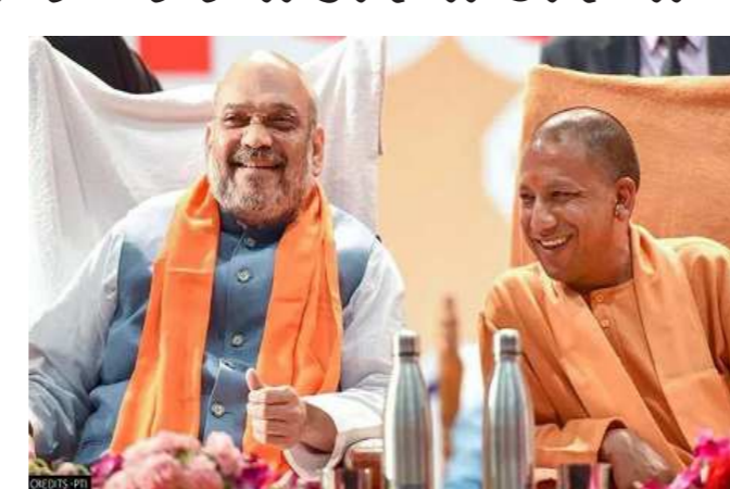
મહિલાઓ અસુરક્ષિત હતી. દિવસે પણ ગોળીઓ ચલાવવામાં આવતી હતી. રાજ્યમાં માફિયાઓનું શાસન હતું. આજે ૨૦૨૧ માં હું યુપીમાં ઉભો છું, હું ગર્વથી કહું છું કે યોગી આદિત્યનાથે ઉત્તર પ્રદેશને આગળ લઈ જવાનું કામ કર્યું. સરકારની યોજનાઓને યોગ્ય રીતે લાગુ કરવામાં આવી છે. યોગી સરકારે ૪૪ યોજનાઓને યોગ્ય રીતે અમલ કરવામાં સફળતા મેળવી છે, જેના કારણે રાજ્યની ઓળખ વિકાસશીલ રાજ્યની બની ગઈ છે. તેમણે કહ્યું કે ભાજપની સરકાર બન્યા બાદ યુપીમાં માફિયા રાજનો અંત આવ્યો છે. રાજ્યમાં જાતિવાદનો અંત આવ્યો છે. રાજ્યના ગરીબ અને નબળા લોકોને સરકારી યોજનાઓનો લાભ મળી રહ્યો છે. ભાજપ ફરી એકવાર યુપીમાં વિકાસના ધોરણે જોરદાર બહુમતી સાથે સરકાર બનાવશે.

લખનૌ,તા.૧ કેન્દ્રીય ગૃહ પ્રધાન અમિત શાહે લખનૌમાં ફોરેન્સિક સાયન્સ સંસ્થાના શિલાન્યાસ કાર્યક્રમમાં પોતાના સંબોધનમાં જણાવ્યું હતું કે, ભાજપે ચાર વર્ષના કાર્યકાળ દરમિયાન રાજ્યમાં કાયદાનું શાસન સ્થાપિત કર્યું છે. રાજ્યને વિકાસના માર્ગ પર લાવવા માટે કામ કરવામાં આવ્યું છે. ૨૦૧૭માં રાજ્યમાં ભાજપની સરકાર સત્તા પર આવી તે પહેલા લોકો પશ્ચિમ યુપીથી સ્થળાંતર કરી રહ્યા હતા. રાજ્ય હુલ્લવગ્રસ્ત હતું, પરંતુ ચાર વર્ષના શાસન પછી, ઉત્તર પ્રદેશમાં કાયદો અને વ્યવસ્થાનું શાસન સ્થાપિત થયું છે. ગૃહમંત્રી અમિત શાહે કહ્યું કે અમે વચન આપ્યું હતું કે જ્યારે અમારી સરકાર આવશે ત્યારે અમે કાયદાનું શાસન સ્થાપિત કરીશું. રાજ્ય સરકારે આ દિશામાં સફળતા