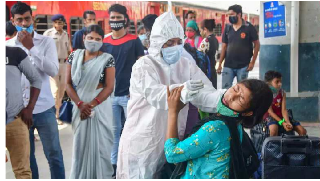
૬,૮૫૯ લોકોને સંક્રમણ લાગ્યું હતું. ૭,૪૩૧ લોકો સાજા થયા અને ૨૨૫ લોકો મૃત્યુ પામ્યા. અત્યાર સુધીમાં ૬૩.૦૩ લાખ લોકો સંક્રમણની ચપેટમાં આવી ગયા છે. આમાંથી ૬૦.૮૦ લાખ લોકો સાજા થયા છે, જ્યારે ૧.૩૨ લાખ લોકો મૃત્યુ પામ્યા છે. હાલમાં ૭૬,૭૫૫ દર્દીઓ સારવાર હેઠળ છે.

લોકડાઉનની જેમ જ કડક પ્રતિબંધો લાદવામાં આવ્યા છે. શનિવારે કેરળમાં ૨૦,૬૨૪ લોકો સંક્રમિત જોવા મળ્યા હતા. ૧૬,૬૮૫ લોકો સાજા થયા અને ૮૦ લોકો મૃત્યુ પામ્યા. અત્યાર સુધીમાં ૩૩.૮૦ લાખ લોકો સંક્રમણની ચપેટમાં આવી ગયા છે. આમાંથી ૩૨.૦૮ લાખ લોકો સાજા થયા છે, જ્યારે ૧૬,૭૮૨ લોકોના મોત થયા છે. હાલમાં ૧.૬૪ લાખ દર્દીઓની સારવાર કરવામાં આવી રહી છે. શનિવારે મહારાષ્ટ્રમાં