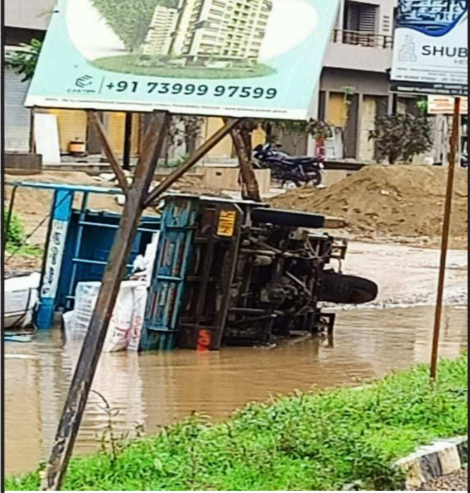
ગાંધીનગર ના સરગાસણ (ઉવારસદ) મા આવેલી શરણ રેસીડેન્સી થી સ્વાગત ફ્લેમિંગો જવાનો માર્ગ અત્યંત કચળી ગયેલ છે. ઊંચાઈ હાલત વાળા માંગિમાં અનેક સ્થળોએ નાના મોટા ખાડા પડી જવા ને કારણે વખતોવખત દ્વિચક્રી વાહનો વાળા ગબડી પડતા હોવાના બનાવો પણ બનતા હોય છે. આજે પણ એક છકડો રીક્ષા પાછી ભરેલા ખાડામાં પલટી મારી ગઈ હતી. આ માર્ગનું સમારકામ તાત્કાલિક ધોરણે હાથ ધરવામાં આવે તેવી માંગ આસપાસના વિસ્તારો માં વસતા વસાહતીઓ દ્વારા ઉઠવા પામી છે.