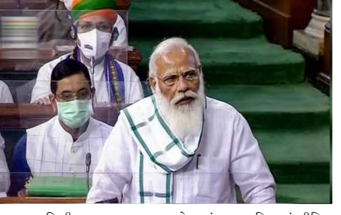
ન્યુ દિલ્હી, તા. ૧૯ સંસદના ચોમાસુ સત્રની આજથી શરૂઆત થઈ રહી છે. આ

જાળવવા અપીલ કરી છે. તેમણે કહ્યું કે, “હું તમામ સાંસદોને આગ્રહ કરીશ કે તેઓ સતત પ્રશ્ન પૂછે, વારંવાર પ્રશ્ન પૂછે, પરંતુ શાંત વાતાવરણ જ જવાબ ઈચ્છે છે, એ જવાબ આપવાની સરકારની સંપૂર્ણ તૈયારી છે. તેમણે કહ્યું કે, અંદરની વ્યવસ્થા પહેલાની માફક નથી. તમામ સાથે બેસીને કામ કરવાના છે, કેમકે લગભગ-લગભગ વેક્સિનેશન થઈ ગયું છે. આ સત્રમાં ફાઈનાન્સિયલ સહિત કુલ ૩૧ બિલ રજૂ કરવામાં આવી શકે છે. આ સત્ર ૧૩ ઓગસ્ટ સુધી ચાલવાનું છે. ચોમાસુ સત્રની શરૂઆતથી પહેલા પીએમ નરેન્દ્ર મોદીએ કહ્યું કે, મને આશા છે કે તેમ બધાં વેક્સિનેશન પહેલો ડોઝ લગાવી દીધો હશે. ત્યારબાદ પણ આપણે કોવિડ પ્રોટોકોલનું પાલન કરવાનું રહેશે. પીએમે કહ્યું કે, કોરોનાની રસી બાહુ (ખબો) પર લાગે છે. આવામાં અત્યાર સુધી ૪૦ કરોડથી વધારે લોકો બાહુબલી બની ચુક્યા છે, પરંતુ આપણે કોવિડ નિયમોનું પાલન કરવાનું છે. પીએમે કહ્યું કે, સરકાર ઈચ્છે છે કે મહામારીના મુદ્દા પર સાર્થક ચર્ચા થાય. આ સાથે જ પીએમ મોદીએ જાણકારી આપી કે તેઓ કાલે સાંજે સદનને કોવિડ પર વિસ્તૃત જાણકારી પણ આપશે. લોકસભા સાંસદ ઓમ બિરલા ચોમાસુ સત્ર માટે સદન પહોંચ્યા અને તેમણે ટ્વીટ કર્યું કે, ‘લોકો ઈચ્છે છે કે તેમના પ્રશ્નો સાંસદો મારફતે સરકાર સુધી પહોંચે. મને આશા છે કે તમામ રાજકીય દળો આ દિશામાં સકારાત્મક ભૂમિકા નીભાવશે.