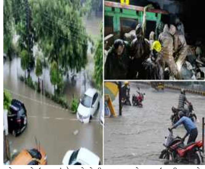
પ્રદેશ અને ઉત્તરાખંડ) અને તેની સાથે જોડાયેલા ઉત્તર-પશ્ચિમ ભારત-પંજાબ, હરિયાણા, રાજસ્થાન, ઉત્તર પ્રદેશ, અને મધ્ય પ્રદેશના ઉત્તરી ભાગોમાં ૧૮થી ૨૧ જુલાઈ સુધીમાં ભારે વરસાદથી અતિ ભારે વરસાદની આગાહી છે.