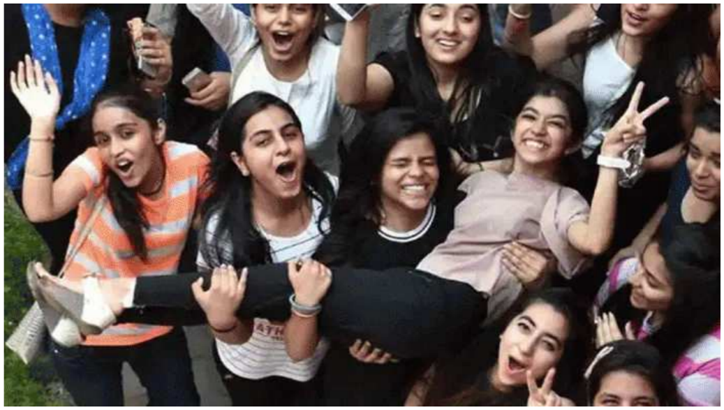
પ્રવાહના નિયમિત ઉમેદવાર માટે સરકાર દ્વારા ગુણાંકન પદ્ધતિ અનુસાર, પરિણામ તૈયાર કરવામાં આવશે. આ પરિણામ પ્રસિદ્ધ થયા બાદ કોઈ વિદ્યાર્થીને પરિણામથી અંસતોષ હોય તો તેવા વિદ્યાર્થી પરિણામ પ્રસિદ્ધ થયાના ૧૫ દિવસમાં પોતાનું પરિણામ ગુજરાત માધ્યમિક અને ઉચ્ચતર માધ્યમિક શિક્ષણ બોર્ડ, ગાંધીનગરની કચેરીમાં જમા કરાવવાનું રહેશે. આવા વિદ્યાર્થીઓ માટે શિક્ષણ બોર્ડ દ્વારા અલગથી પરીક્ષા યોજવામાં આવશે. આ અંગેનો કાર્યક્રમ હવે પછી જાહેર કરવામાં આવશે.

રાજ્યમાં કોરોના મહામારીની સ્થિતિને જોતા રાજ્ય સરકારે ધો-૧૨ વિજ્ઞાન પ્રવાહના વર્ષ ૨૦૨૧ના નિયમિત ઉમેદવારોની પરીક્ષા રદ કરીને પરિણામ જાહેર કરવા માટે એક નવી નીતિ જાહેર કરી હતી જે મુજબ વિદ્યાર્થીઓને માસ પ્રમોશન આપવામાં આવ્યું છે. જોકે ગુજરાત માધ્યમિક અને ઉચ્ચતર માધ્યમિક શિક્ષણ બોર્ડ દ્વારા જાહેર કરવામાં આવેલા પરિણામમાં ક્યાં માસ પ્રમોશનનો ઉલ્લેખ કરવામાં આવ્યો નથી અને વિદ્યાર્થીઓને પરંપરાગત માર્કશીટ જ આપવામાં આવશે. હાલ ફક્ત શાળાઓ જ પરિણામ જોઈ શકતી હોવાથી વિદ્યાર્થીને પોતાનું પરિણામ જાણવા માટે શાળાનો જ સંપર્ક કરવાનો રહેશે. ધોરણ ૧૨ના તમામ વિદ્યાર્થીઓએ પરીક્ષા આપી હતી. R2 ગ્રેડમાં આખા રાજ્યમાં ૪ વિદ્યાર્થીઓ અને સુરતનો ૧ વિદ્યાર્થીનો સમાવેશ થાય છે. રાજ્ય શિક્ષણ બોર્ડ દ્વારા આજે ધોરણ ૧૨ સાયન્સ વિજ્ઞાન પ્રવાહનું પરિણામ જાહેર કરવામાં આવ્યું છે. આ પરિણામમાં ગુજરાતી માધ્યમમાં ફક્ત બે વિદ્યાર્થીઓને અંગ્રેજી માધ્યમમાં ફક્ત બે વિદ્યાર્થીઓનું પરિણામ નબળુ સામે આવ્યું છે. આમ કુલ ચાર વિદ્યાર્થીઓનું સમગ્ર રાજ્યમાં પરિણામ નબળુ આવ્યું છે. ઉલ્લેખનીય છે કે, ધોરણ ૧૨ સાયન્સમાં કુલ ૧,૪૦,૩૬૩ વિદ્યાર્થી નોંધાયા છે, જેમાં ૧,૦૭,૭૧૧ વિદ્યાર્થી નિયમિત છે જ્યારે ૩૨,૬૫૨ વિદ્યાર્થી રિપીટર્સ નોંધાયા હતા.