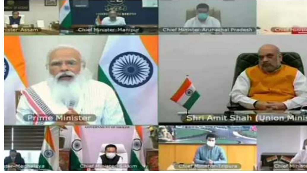
અડચણ ન આવે. સ્કિલ્ડ મેનપાવરને પણ તૈયાર કરી લો. ભૌગોલિક સ્થિતિને જોતાં અસ્થાયી હોસ્પિટલ બનાવવી ખૂબ જરૂરી છે. ટ્રેન્ડ મેનપાવરની જરૂરિયાત છે. ICU બેડ, ઓક્સિજન બેડ, ડેસ્ટ રોજ કરવાની ક્ષમતા પ્રાપ્ત કરી નવી હોસ્પિટલો માટે નવા ટ્રેન્ડ ચૂકવો છે. નોર્થ-ઈસ્ટના દરેક મેનપાવરની જરૂર છે. એની સાથે જિલ્લામાં ટેસ્ટિંગની ક્ષમતા વધારવી પડશે. રેન્ડમ ટેસ્ટિંગને એગ્રેસિવ કરવું પડશે. સમગ્ર દેશ ૨૦ લાખથી વધુ

ક્ષેત્ર સાથે જોડાયેલા લોકો વેક્સિનેશન માટે લોકોને જાગૃત કરે. આપણે ટેસ્ટિંગ અને ટ્રીટમેન્ટના ઈન્ફ્રાસ્ટ્રક્ચરમાં સુધારો કરીને આગળ વધવાનું છે. કેબિનેટ ૨૩ હજાર કરોડ રૂપિયાનું નવું પેકેજ આપ્યું છે. નોર્થ-ઈસ્ટના દરેક રાજ્યને આ પેકેજથી પોતાના હેલ્થ ઈન્ફ્રાસ્ટ્રક્ચરને મજબૂત કરવામાં મદદ મળશે. જ્યાં કેસ વધી રહ્યા છે ત્યાં ICU બેડ વધારવામાં મદદ મળશે. ઓક્સિજન પર કામ કરવું પડશે. સમગ્ર દેશમાં ઓક્સિજન પ્લાન્ટ લગાવવામાં આવી રહ્યા છે. નોર્થ-ઈસ્ટ માટે ૧૫૦ પ્લાન્ટ મંજૂર થયા છે. એ ઝડપથી પૂર્ણ થાય અને