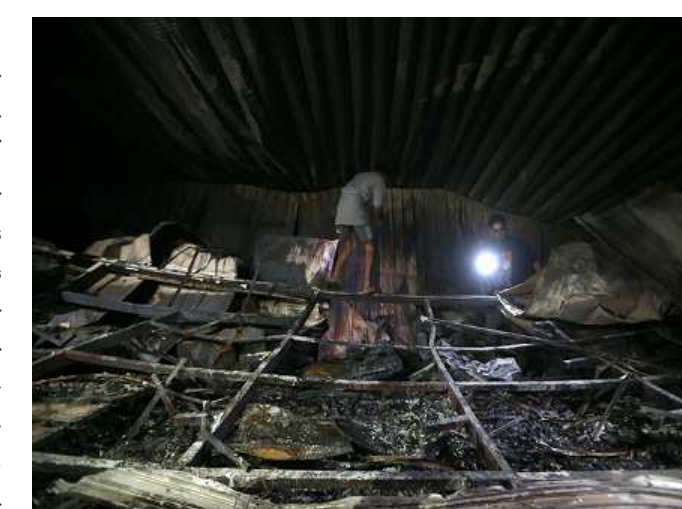
બગદાદ, તા. ૧૩ ઈરાકના દક્ષિણ શહેર નસીરિયાની અલ-હુસૈન કોવિડ હોસ્પિટલમાં ભીષણ આગ ભભૂકી ઊઠી હતી. આગમાં ૨ આરોગ્યકર્મચારી સહિત ૬૪ લોકોનાં મોત નીપજ્યાં અને ૧૦૦ લોકો ઘાયલ થયા હતા. આગને કાબૂમાં લેવામાં આવી છે. કોવિડ વોર્ડમાં ઓક્સિજન-ટેકમાં વિસ્ફોટથી આગ લાગી હોવાનું પ્રાથમિક તપાસમાં બહાર આવ્યું છે.

આ ઘટના બાદ વડાપ્રધાન મુસ્તફા અલ-કદમીએ વરિષ્ઠ પ્રધાનોની બેઠક બોલાવી છે, જેમાં નસીરિયા હોસ્પિટલના સિક્વોરિટી મેનેજરને સસ્પેન્ડ કરીને ધરપકડ કરવા આદેશ આપવામાં આવ્યા છે. અકસ્માત દરમિયાન આરોગ્યકર્મચારીઓએ કોવિડ હોસ્પિટલમાંથી સળગતા મુતદેહોને બહાર કાઢ્યા હતા, જ્યારે ધુમાડાને કારણે દર્દીઓ ઉધરસ ખાતા હતા. આ અકસ્માતની તપાસ શરૂ કરી દેવામાં આવી છે, જેથી આગ લાગવાનું કારણ જાણી શકાય. ઘણા લોકો લાપતા થયા હોવાનું જણાવાયું હોવાથી મૃત્યુઆંક વધી શકે છે.