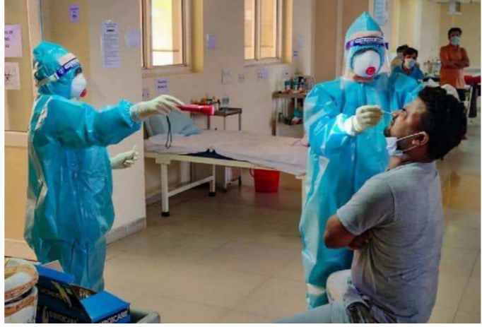
પોઝિટિવિટી રેટ ૫%ની નીચે રહ્યો છે, જે હાલ ૨.૩૭% છે. દૈનિક પોઝિટિવિટી રેટ ૨.૪૨% સાથે પાછલા ૧૭ દિવસથી ૩% કરતા નીચો રહ્યો છે. ૧૬ જાન્યુઆરીએ ભારતમાં કોરોનાની રસીના અભિયાનો પ્રારંભ કરવામાં આવ્યો હતો જેમાં અત્યાર સુધીમાં કુલ ૩૬,૪૮,૪૭,૫૪૮ ડોઝ આપવામાં આવ્યા છે. જેમાં ૩૩,૮૧,૬૭૧ ડોઝ પાછલા ૨૪ કલાકમાં આપવામાં આવ્યા છે.

ન્યુ દિલ્હી, તા.૮ દેશમાં કોરોનાની બીજી લહેર નબળી પડ્યા બાદ છૂટછાટો મળવાની વધતા નવા કેસની સંખ્યા ઘટીને ૫૦ હજારની અંદર પહોંચ્યા બાદ ઉપર-નીચે થઈ રહી છે. ગઈકાલની સરખામણીમાં નવા કેસમાં વધારો થયો છે, ગઈકાલે ૨૪ કલાકમાં ૪૩,૭૩૩ નવા કેસ નોંધાયા હતા, જ્યારે આજે તેમાં વધારો થયો છે પરંતુ મૃત્યુઆંકમાં ઘટાડો નોંધાયો છે. સરકાર દ્વારા છૂટછાટો મળતા પ્રવાસન સ્થળો પર દેખાતી ભીડને લઈને ચિંતા વ્યક્ત કરી હતી, જે પ્રમાણે લોકો કોરોનાને ભૂલીને ફરી રહ્યા છે તે ભવિષ્યમાં ભરી જોખમી સાબિત થઈ શકે છે. કેન્દ્રીય સ્વાસ્થ્ય મંત્રાલય દ્વારા જાહેર કરવામાં આવેલા આંકડા પ્રમાણે દેશમાં પાછલા ૨૪ કલાકમાં કોરોનાના વધુ ૪૫,૮૯૧ કેસ નોંધાયા છે જેની સામે સાજા થનારા દર્દીઓની સંખ્યા ૪૪,૨૯૧ નોંધાઈ છે. દૈનિક કોરોનાથી થતા મૃત્યુનો આંક ૮૧૭ રહ્યો છે જે ગઈકાલની સરખામણીમાં ઓછો છે, ગઈકાલે એક દિવસમાં કોરોનાથી ૮૩૦ મોત નોંધાયા હતા. ભારતમાં કોરોનાના કુલ કેસની સંખ્યા ૩,૦૭,૦૮૮,૫૫૭ થઈ છે જ્યારે સાજા થનારા દર્દીઓની સંખ્યા ૨,૮૮,૪૩૩,૮૨૫ સાથે ૩ કરોડની નજીક પહોંચી ગઈ છે. દેશમાં કોરોનાના લીધે કુલ ૪,૦૫,૦૨૮ દર્દીઓના મોત થઈ ગયા છે. દેશમાં પાછલા લાંબા સમયથી કોરોનાના નવા કેસની સામે સાજા થનારા દર્દીઓનો આંકડો ઊંચી રહેવાથી એક્ટિવ કેસ ૪,૬૦,૭૦૪ થયો છે, જે ગઈકાલે ૪,૫૮,૮૨૦ હતો, જેમાં આજે વધારો થયો છે. સ્વાસ્થ્ય મંત્રાલયના જણાવ્યા પ્રમાણે ભારતમાં કોરોનાના કુલ કેસની સામે એક્ટિવ કેસની ટકાવારી ૧.૫૦% થાય છે, સાજા થનારા દર્દીઓની ટકાવારી વધીને ૯૭.૧૮% થઈ છે. સાપ્તાહિક