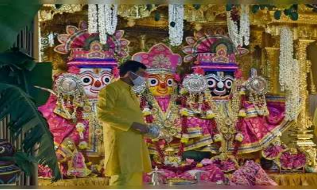
ગાંધીનગર, તા.૮ અમદાવાદમાં ૧૪૪મી રથયાત્રાને સીએમ રૂપાણી સરકારે પરવાનગી આપી દીધી છે. રાજ્યના ગૃહ રાજ્યમંત્રી પ્રદિપસિંહ જાડેજાએ પ્રેસ કોન્ફરન્સ કરીને આ જાણકારી આપી હતી. કર્ફ્યુ સાથે અમદાવાદમાં રથયાત્રા નીકળશે. અને મંગળા આરતીમાં કેન્દ્રીય ગૃહમંત્રી અમિત શાહ ઉપસ્થિત રહેશે. સાથે જ પહિંદ વિધિ સીએમ રૂપાણી અને નીતિન પટેલ દ્વારા કરવામાં આવશે. રથયાત્રાના સમગ્ર માર્ગ પર

પ્રસાદના વિતરણ પર પ્રતિબંધ રહેશે. રથયાત્રા જ્યાંથી પસાર થવાની છે ત્યાં કર્ફ્યુનો અમલ કરાવીને મંદિરથી પ્રસ્થાન કરીને નીજ મંદિરે પરત આવે ત્યાં સુધી દર્શનાર્થીઓ એકાએક રથની નજીક આવીને કોરોના પ્રોટોકોલનો ભંગ ન થાય તે માટે કર્ફ્યુના અમલ સાથે રથયાત્રા કાઢવાની પરવાનગી આપી છે. અમદાવાદની ઐતિહાસિક અને ભવ્ય રથયાત્રા છે તેમાં સવારે દેશના ગૃહમંત્રી અમિત શાહ મંગળા આરતીની અંદર ઉપસ્થિત રહીને વર્ષોની પરંપરા અનુસાર હાજર રહેશે. અને સવારે રથના પ્રસ્થાનની પહિંદ વિધિ સીએમ વિજય રૂપાણી અને નીતિન પટેલની ઉપસ્થિતિમાં મર્યાદિત લોકોની હાજરીમાં પહિંદ વિધિ કરી અને પછી રથનું પ્રસ્થાન કરવામાં આવશે.