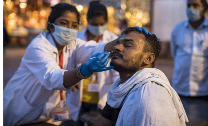
અગ્રવાલે કહ્યું કે ગત ચાર અઠવાડિયામાં દિલ્હી, ઉત્તર પ્રદેશ, છત્તીસગઢ, ગુજરાત, ઝારખંડ, પંજાબ, મધ્ય પ્રદેશ અને રાજસ્થાનમાં પરિસ્થિતિ વધારે ચિંતાજનક છે. ૧૦ દિવસમાં કેસ ૪ લાખને પાર પહોંચ્યા છે. દેશભરમાં સંક્રમણની સ્પીડીની વાત કરીએ તો ગત ૧૦ દિવસમાં કોરોનાના દર્દીના આંકડા રોજના ૩ લાખને પાર થયા છે. આ પહેલા ૨૧ એપ્રિલથી રોજના ૩ લાખથી વધારે મામલા સામે આવ્યા છે. ૨૧ એપ્રિલે જ્યાં ૩.૧૫ લાખ દર્દી મળ્યા હતા. ત્યારે ૨૨ ના રોજ ૩.૩૨ લાખ, ૨૩ના રોજ ૩.૪૫ લાખ, ૨૪ના રોજ ૩.૪૮ લાખ, ૨૫ ના રોજ ૩.૫૪ લાખ, ૨૬ના રોજ ૩.૬૧ લાખ, ૨૭ના રોજ ૩.૬૯ લાખ, ૨૮ના રોજ ૩.૭૯ લાખ, ૨૯ ના રોજ ૩.૮૬ લાખ અને ૩૦ એપ્રિલે ૪.૦૧ લાખ નવા દર્દી મળ્યા છે.