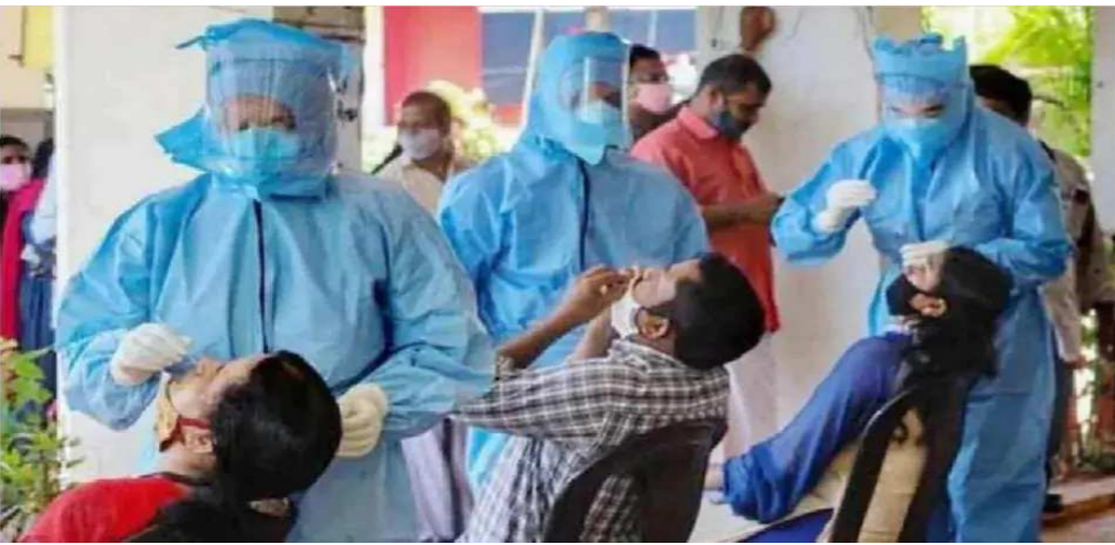
ન્યુ દિલ્હી, તા. ૨૮ ભારતમાં કોરોના વાયરસના દૈનિક આંકડાઓમાં ઘટાડો ચાલુ છે. શુક્રવારે (૨૮ મે) છેલ્લા ૨૪

કલાકમાં કોરોના વાયરસના ૧,૮૬,૩૬૪ નવા કેસ સામે આવ્યા છે જે દેશમાં ૪૪ દિવસો બાદ કોવિડ-૧૯ના સૌથી ઓછા નવા કેસ સામે આવ્યા. વળી, છેલ્લા ૨૪ કલાકમાં ૨,૫૮,૪૫૯ કોવિડ-૧૯થી રિકવરી થઈ ગયા છે. આ દરમિયાન કોરોનાથી થઈ રહેલ